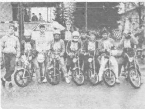
Srednješolci SŠS, udeleženci občinskega tekmovanja »Kaj veš o prometu?«