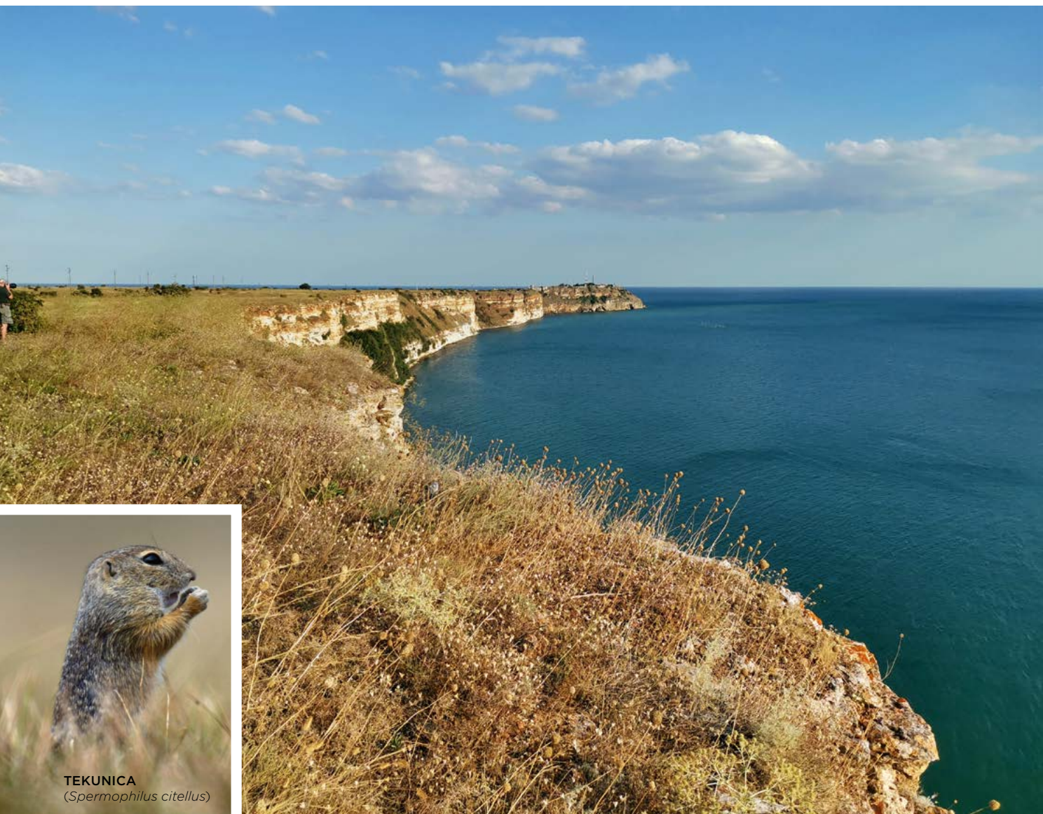
TEKUNICA ( Spermophilus citellus )