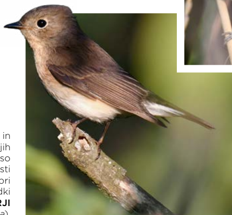
V grmovnih in gozdnih sestojih na Kaliakri so našo pozornosti zbudili pri nas zelo redki MALI MUHARJI ( Ficedula parva ).