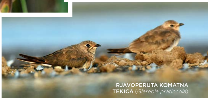
RJAVOPERUTA KOMATNA TEKICA ( Glareola pratincola )

sistem lagun, ki se nadaljuje v delto Donave. V nasprotju z delto, kjer brez čolna in lokalnih vodnikov ni veliko možnosti za raziskovanje, je ta del veliko bolj prijazen za samostojno odkrivanje njegovih skrivnosti.