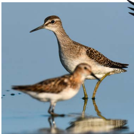
V okolici Rta Kaliakra so se zadrževali številni pobrežniki, med njimi tudi MOČVIRSKI MARTINCI ( Tringa glareola ) in MALI PRODNIKI ( Calidris minuta ).