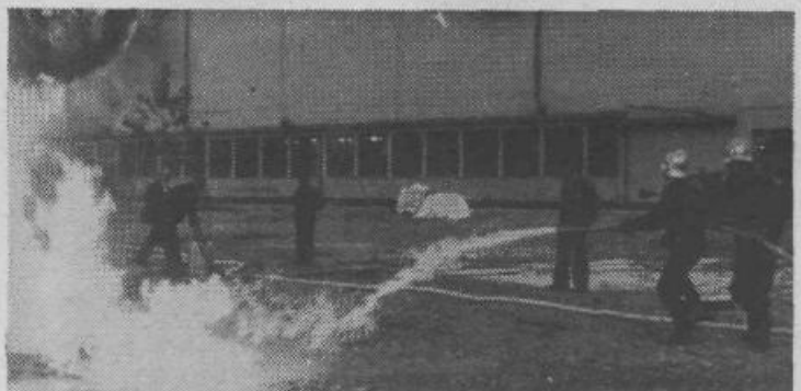
Člani gasilskega društva Papirnice Vevče so v tednu požarne varnosti organizirali vajo: gašenje lahko vnetljivih tekočin. Gasili so s težko in s srednje lahko peno. Prikaz gašenja jim je dobro uspel.