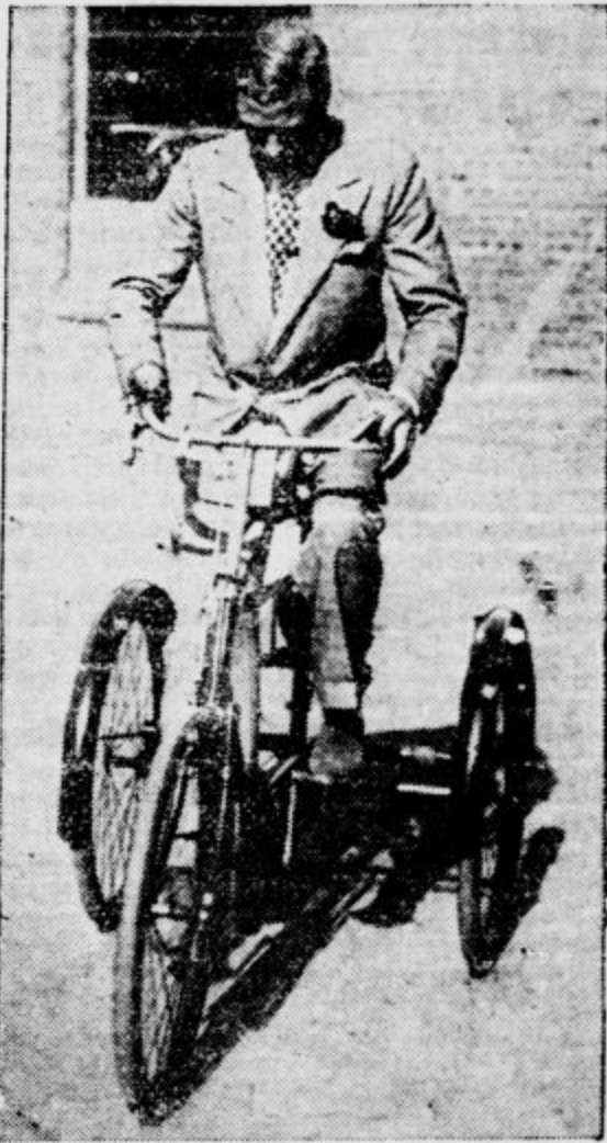
Angleški prestolonaslednik je te dni prezkusil svojo spretnost na triciklu svojega deda, priljubljenega kralja Edvarda VII.