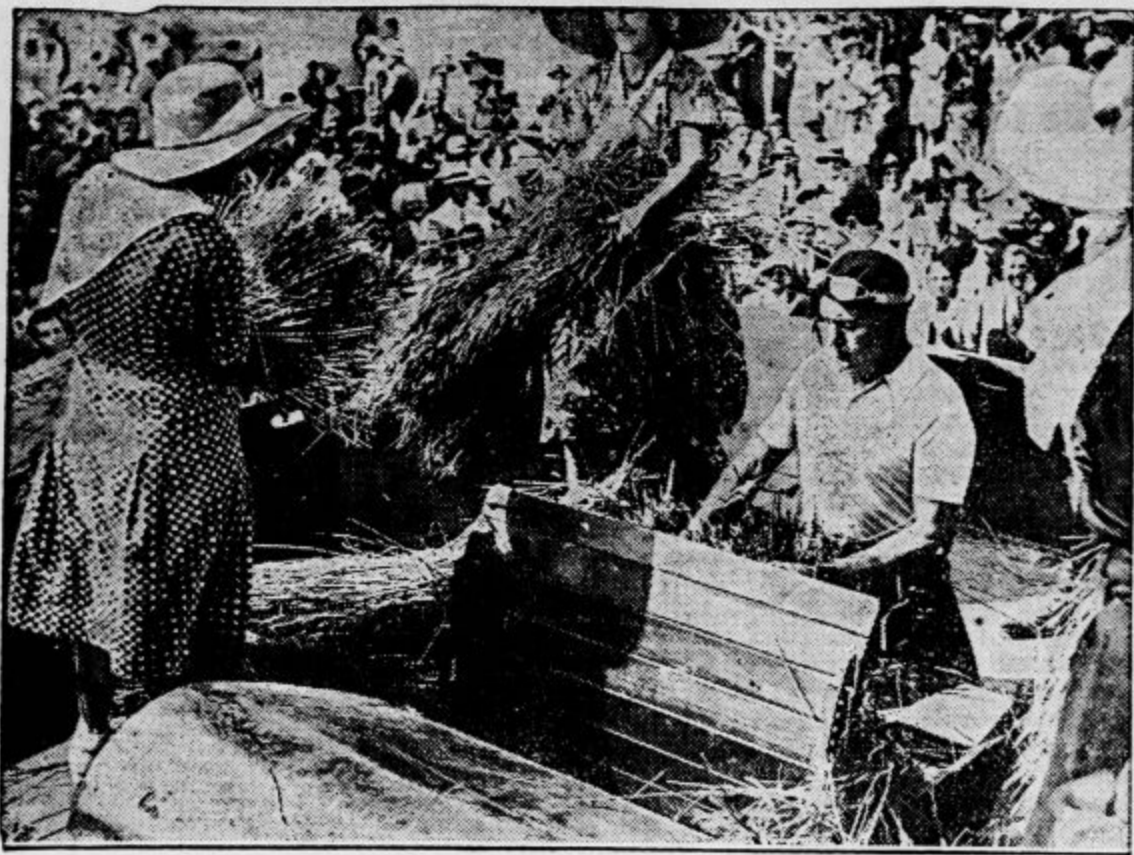
Na inspekcijski vožnji skozi Agro Pontino je Mussolini prošle dni otvoril mlatev in sam šel na mlatičnico ter potikal v stroj snope žita, ki so mu jih podajala dekleta.