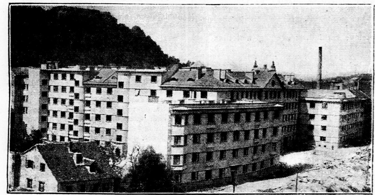
Pogled na Rdečo palačo s Poljanskega nasipa

Na podlagi izpovedb prič je državni tožilec umaknil obtožbo radi uboja in predlagal kaznovanje radi prekoračenja silobrana. Obravnava, ki je zadnja v jeenskem zasedanju, ob sklepu lieta še ni bila končana.