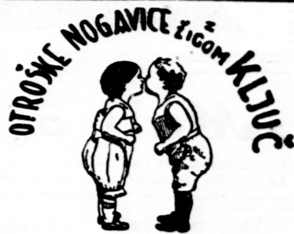
Najboljše, najtrajnejše, zato najcenejše

Zubkov je sklenil osvetiti se Viljemu za žalitev. Začel je zbirati karikature bivšega nemškega cesarja in vsak dan mu pošlje v Doorn eno z lastnoročnim podpisom. Da ga še bolj ujezi, napiše na karikaturi: »Od Tvojega ljubečega svaka.«