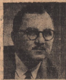
Hon. John Yaremko, Q.C., Minister