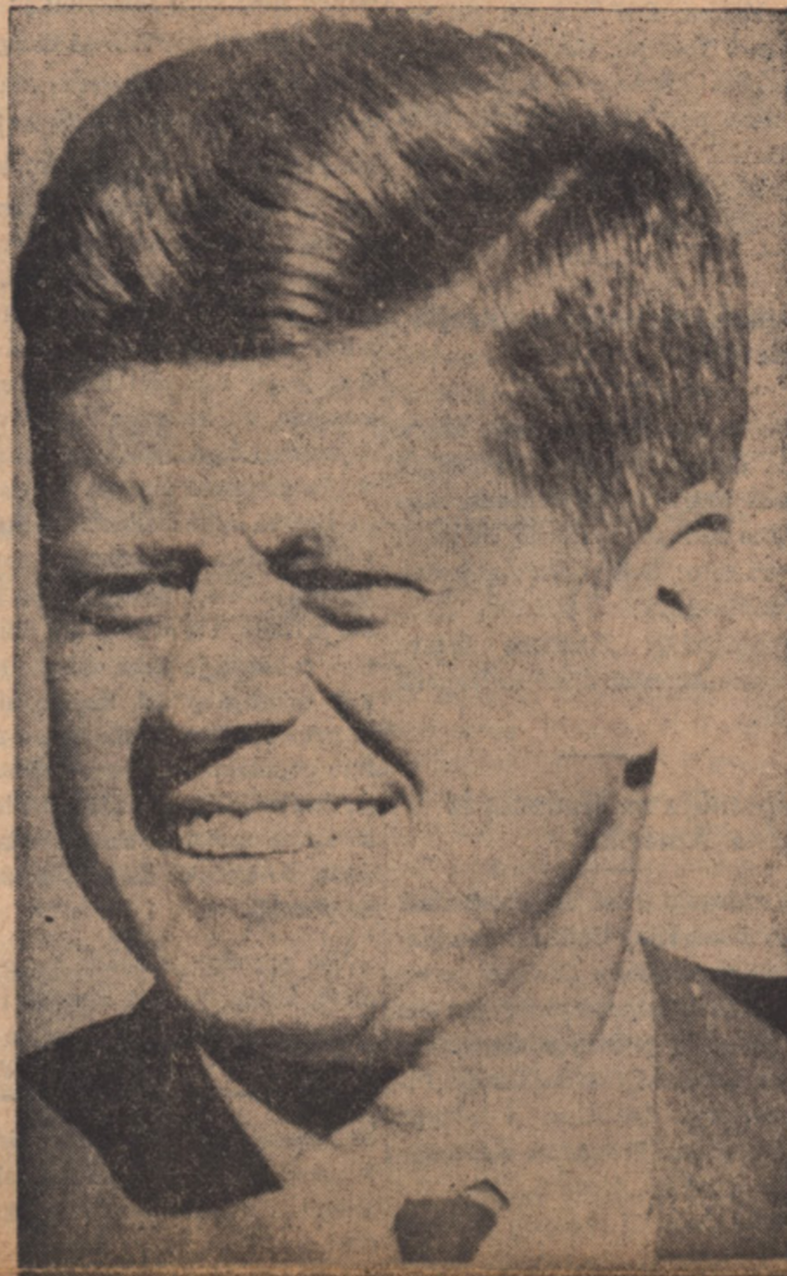
Najmlajši predsednik Združenih ameriških držav John F. Kennedy, v katerega so uprte oči vsega svobodnega sveta in "modernih sužnjev", je nastopil službo 20. januarja 1961.

"Trombe nas sedaj kličejo znova... k borbi proti skupnim sovražnikom človeka: tiraniji,