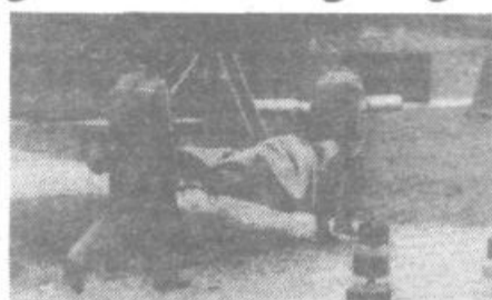
Ponesrečene je bilo treba spraviti na varno

»Prav gotovo je prav, da se preveri, koliko so vse te družbene organizacije in društva v skupnem odredu CZ pripravljene,« je ob koncu vaje na kratko