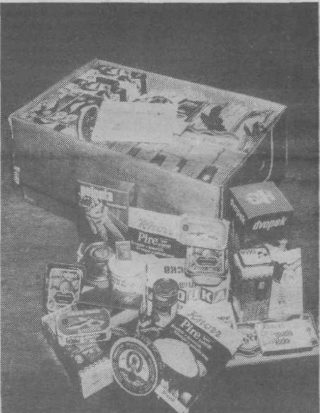
Paket DANES IN JUTRI 84 se predstavlja

Kolinske. »Predstavniki nasega podjetja se bodo povezali s tovarnami in ustanovami, tako da bo imel res vsako možnost za nakup novega in dopolnitev starega paketa.« Obenem je še dejal, da so prvih 100 paketov že poslali na potresno območje v Črno goro. Pakete so tudi razstavljali na sejmju civilne zaščite, ki je bil prve dni junija v K: nju. Kot zanimivost naj navedemo še nekaj izdelkov v paketu rezervne hrane: razni instant napitki, instant polenta, sardine, ribe z zelenjavo, različne juhe, preliv za