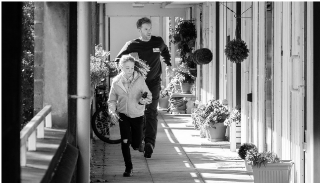
Medtem, ko vas ni bilo (2019)