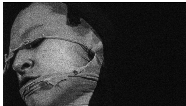
Popkasta zgodba (1985)