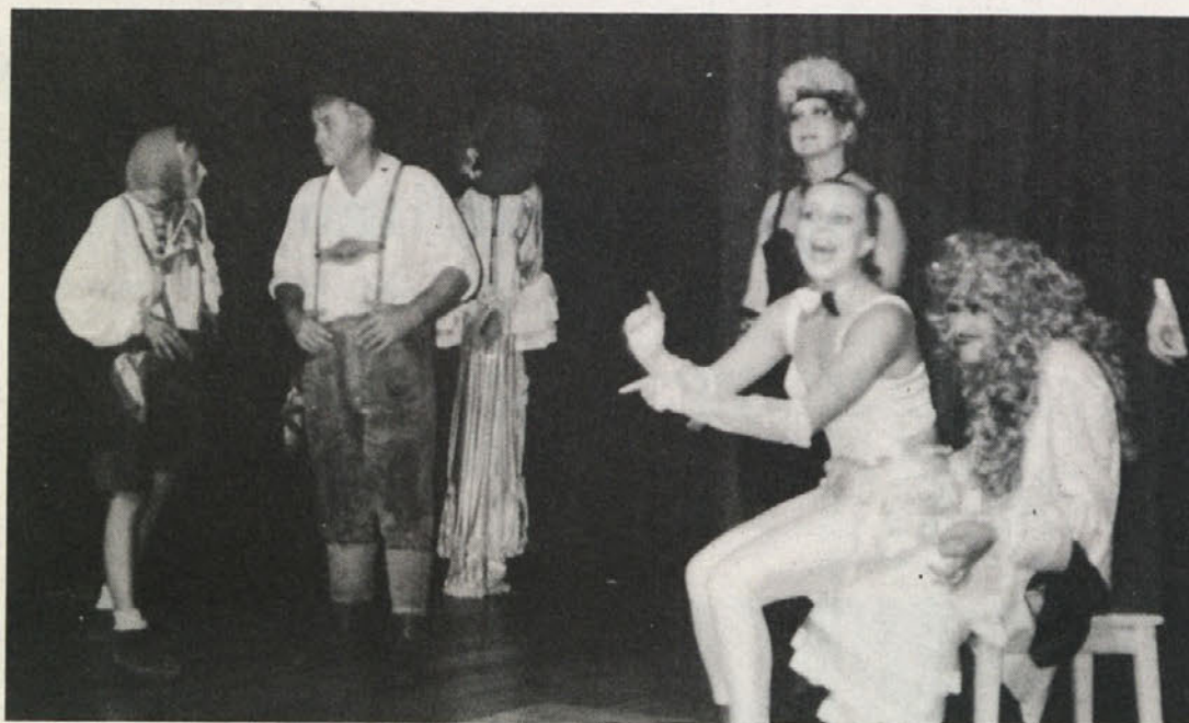
Martin Krpan je moral na Dunaj pripeljati svojo kobilico

Kulturni spored bodo obogatili člani domačega prosvetnega društva „Jepa-Baško jezero“. Bivše izseljence vabimo, da se prireditve udeležijo s svojimi družinami, prijatelji in znanci!