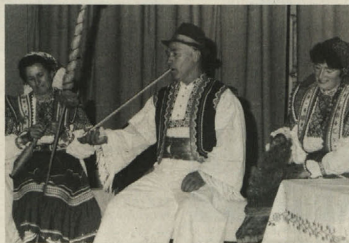
Člani folklorne skupine v Nižnjem Selišču