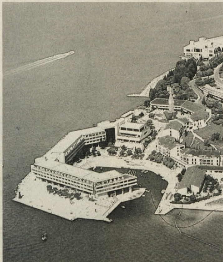
Na tem čudovitem koščku slovenske obale bomo letos udeleženci Vestnikovega izleta preživeli skoraj tri dni in dve noči.

Še do 30. septembra je čas, da se prijavite za