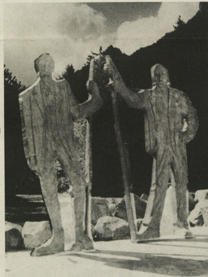
Spomenik Frischau in Kocbeku v Logarski dolini