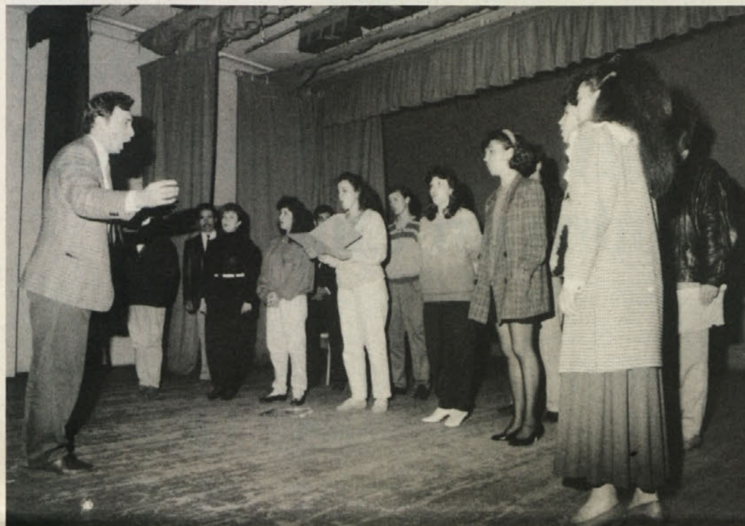
Ukrajinski pevski zbor „Cantus“

Tem nejasnostim brezdvomno botruje tudi strah Ukrajine