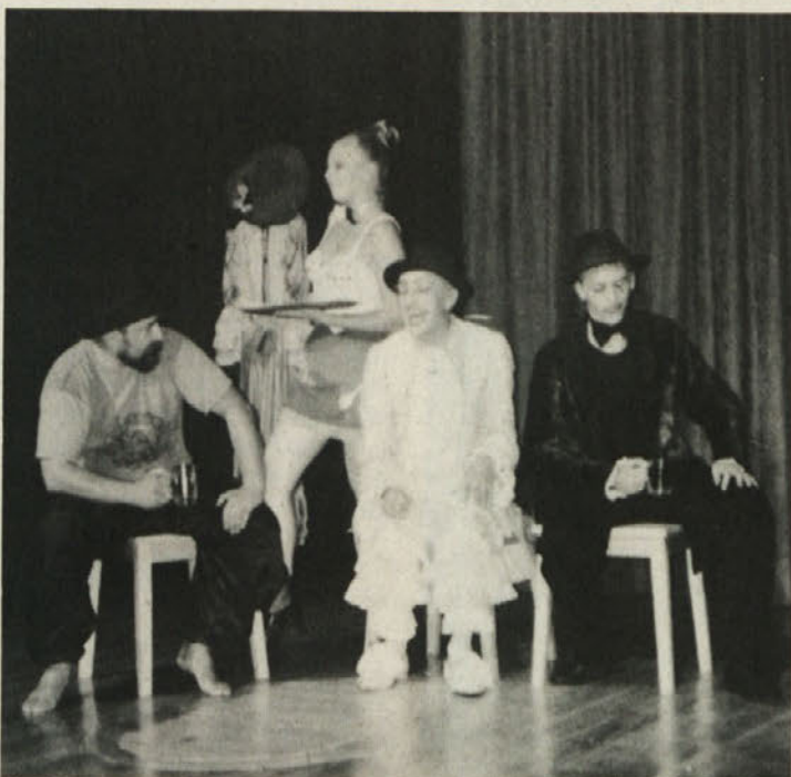
Je Krpan posekal lipo ali hrast?