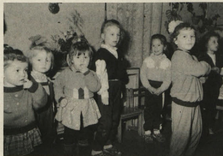
Otroci iz vrtca v Instičevem so zapeli in zaplesali