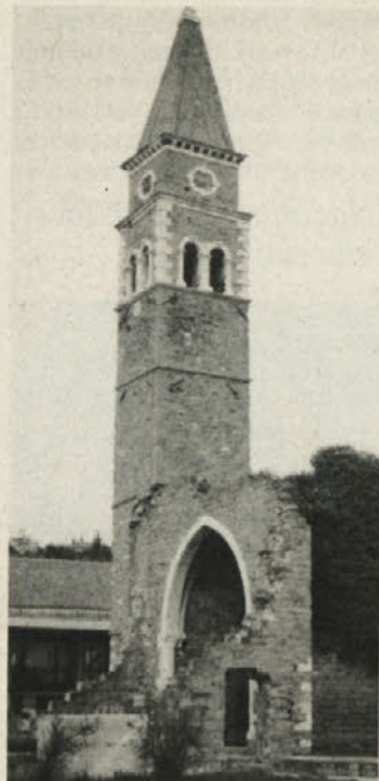
Sredi hotelskega naselja je lepo restavrirana stara cerkev svetega Bernarda.

PREŽIHOV Voranc Maiglöckchen: elf Kindheitsgeschichte. – Klgt.: Drava: Trieste: Editoriale stampa Triestina SpA, 1985. – 97 str.