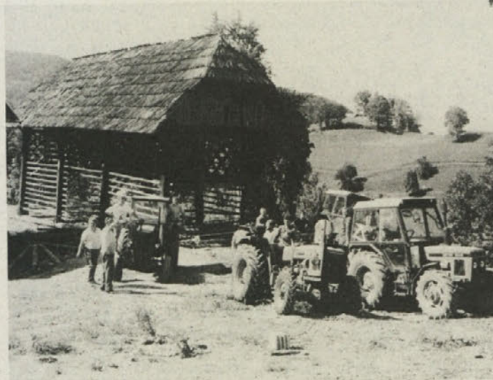
Predstavili so kozolec „toplara“

Celjski planinci so ob svojem domu v Logarski dolini obeležili 100-letnico planinstva na Slovenskem in enako obletnico Savinjske podružnice Slovenskega planinskega društva.