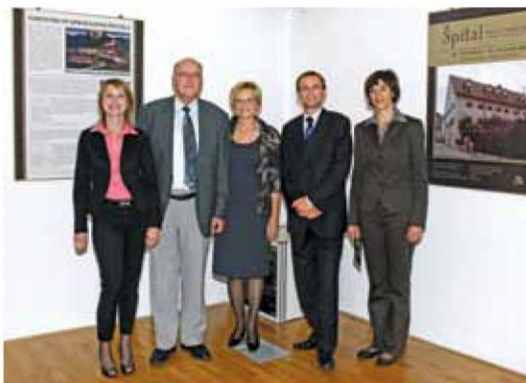
Ob odprtju razstave Špital – hiša na robu družbe, 28. septembra 2010, v Sokolskem domu v Škofji Loki.

V ubožnici je bilo prostora za 15 do 30 oseb, največ jih je bilo poleti 1945, ko so jih našteali kar 39. Večinoma so prihajali z loškega področja, le izjemoma iz drugih občin. Pred 1. svetovno vojno so bili bolj ali manj prepuščeni sami sebi. V ubožnici so imeli poskrbljeno za stanovanje in kurjavo, hrano so dobivali pri kapucinih, uršulinkah in dobrotljivih meščanih. O organizirani skrbi zanje lahko govorimo šele od leta 1917 dalje, ko se jim je posebej posvetil novi loški kaplan Filip Terčelj. Ustanovil je društvo Dobrodelnost, ki je naslednjih šest let skrbelo zanje, po ukinitvi društva so te naloge prevzele redovnice iz Maribora, kasneje iz Ljubljane. Plačevala jih je mestna občina. S prihodom šolskih sester so