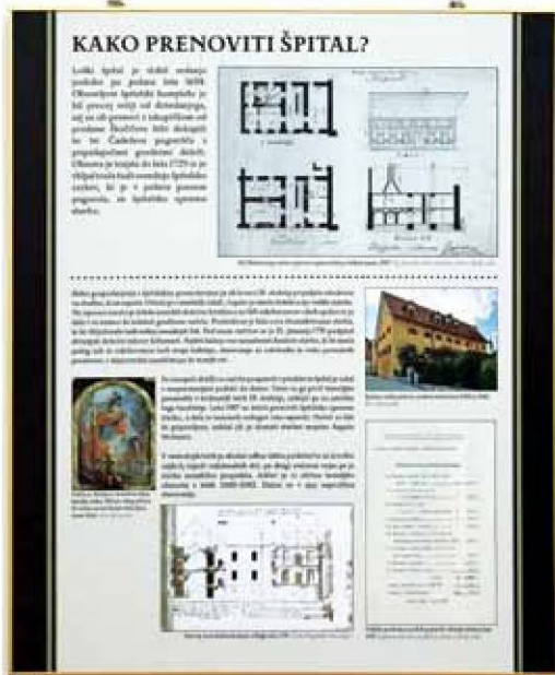
Eden od razstavnih panojev je poskušal odgovoriti na vprašanje: »Kako prenoviti ubožnico?«