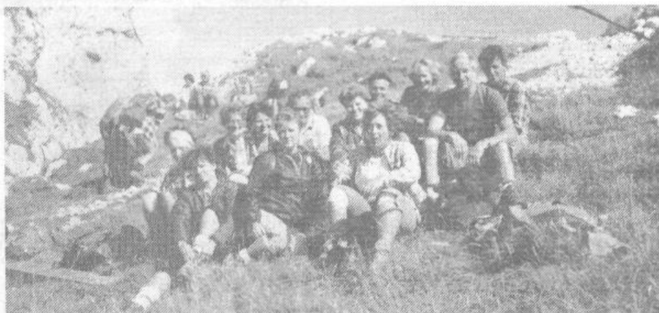
Skupni počitek po osvojitvi dveh dvatisočakov – Kočne in Grintovca

Mraz in sneg, ki neusmiljeno priškatata te zimske mesece, še kako občutijo tudi ptice. Izvor njihove naravne hrane, ki sicer predstavlja njihov redni jedilnik, je namreč omejen na minimum in malim gozdnim živalcem praktično ne preostane drugega, ko da se zatečejo v bližino človeških bivališč. Še posebej vztrajno te dni stikajo okrog naših oken in sklednjev ptice pevke kot so: sinice, meniškici, plavčki, ščinkovci, zelenčki, gozdni brglezi, tašičice, dleski in kalini, medtem ko si nekatere druge ptice, še zlasti večje, po svojih močeh pomagajo v okolju, v katerem žive tudi čez leto. Prav in človeško bi bilo, ko bi se vsaj v najbolj mrdlih dneh spomnili teh naših malih pernatih gostov in jim tu pa tam natresli kako prgišče semen.