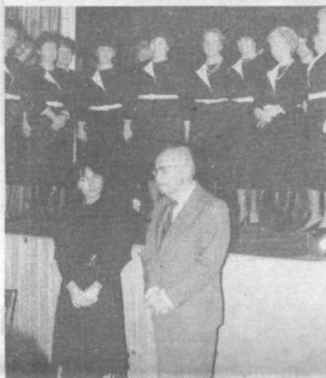
Kulturni trenutek na Brdu

«Ko smo se lani v Velikih Laščah s ponosom spominjali, da smo narod, ki je svojo svobodoljubnost in trdovitost skrnil v pisano besedo, ki nam jo je dal slovenski protestantizem, smo ugotavljali, da je bil svobodni duh razsvetljenstva sicer ugašen, ampak nikoli zares ugašen; živ je tlel pod plastmi janzenzima in se utelešen v kmečkih uporih in NOB sveti v kulturnem izročilu, ki nas uvršča med kulturne narode sveta.»