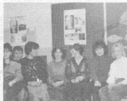
Člani KUD Želimlje

Kolikor članov KUD-a iz Želimlje se je sestalo na svojem 1. sestanku v letu 1987, toliko in prav istih je predstavilo recital slovenske besede na predvečer kulturnega praznika, 8. februarja. Zimski, sobotni večer je privabil le manjše število vaščanov v toplo učilnico podružnične šole, toda navdušenje in pristnost nastopajočih mladine je bila občudujoča. Priprave na počastitev kulturnega praznika so se odvijale nemoteno, z veliko voljo in prizadevnostjo članov KUD-a, ki niso zamudili vaj kljub poznemu prihodu iz služb in šol (Želimlje namreč nima večernih avtobusnih zvez z Ljubljano). V lepo okrašeni učilnici, ob siju sveč, šopku nageljnov in razstavi novejših mladinskih knjižnih del, se je odvijal program vezane in nevezane besede, pesmi in dialoga Jurčičevega Krjavlja. Mladinci so obiskovalce pri vходу pričakali s soljo in kruhom. Prijazno, so odmevali tudi zvoki