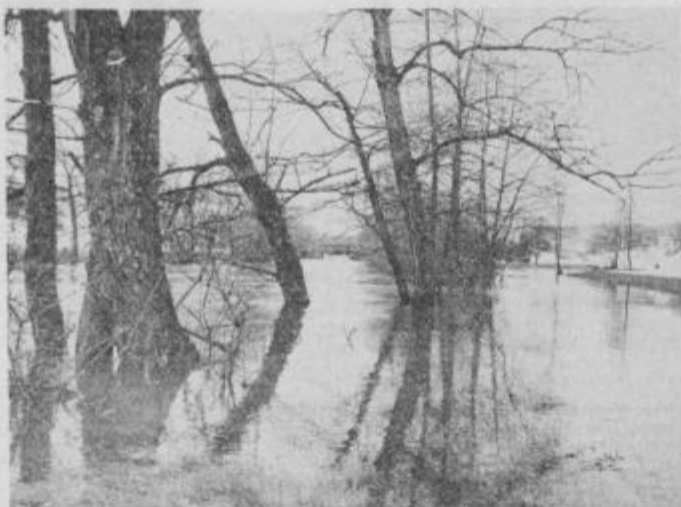
Pri Slapah pod Ptujsko goro se je Dravinja razlila na širšem območju

Poleg škode, ki jo je povzročil moker sneg na sadnem in drugem