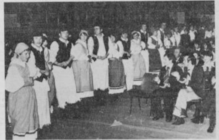
Folklorna skupina je sodelovala tudi na občinski proslavi v pozdrav osmemu kongresu ZKS

in ostale slovenske plesne. S svojimi nastopi so si pridobili že vrsto simpatij. Največkrat zaplešejo ob različnih praznovah v krogu zdravstvenih delavcev, večkrat pa so že nastopili na drugih javnih prireditvah. Ponovna predstavitev jih čaka ob proslavi 27. aprila in 1. maja v bolnišnici, nastopili bodo tudi na osrednji prvomajski proslavi v Ptuj, ki bo na prostoru Ptujskih toplih. Tudi na veliki proslavi ob dnevu medicinskih sester, ki bo 12. maja v Mariboru, bodo