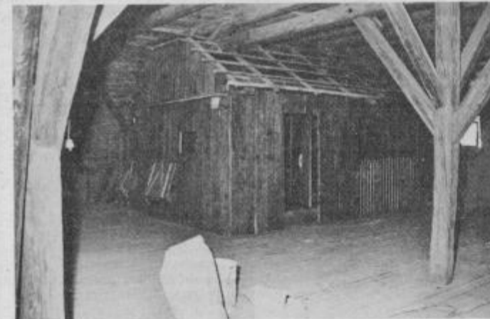
Pod streho nekdanje žitnice nastaja pravo naselje za etnološki muzej in zbirko mask.