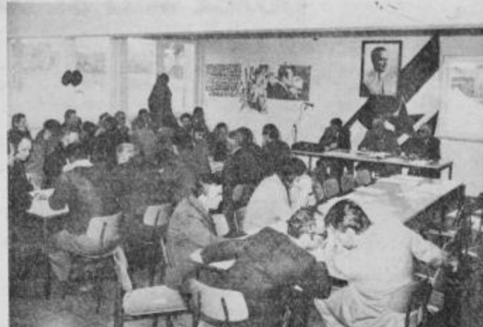
Delegati pododborov ribiške družine Ptuj na sobotni skupščini