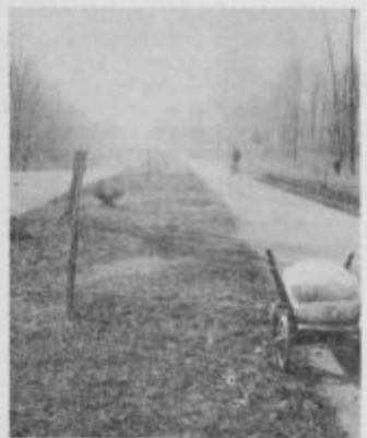
Kljub pomanjkanju cementa je nek graditelj pustil dve vreči kar na cesti

Če ne bi verjeli obvestilom v sredstvih obveščanja, da spet primanjkuje cementa, bi se lahko o tem sami prepričali, če bi bili med graditelji in bi ga nujno