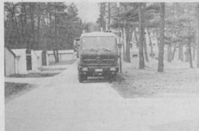
Ob tem je čudno, da še stoji drog za cestno razsvetlavo

parkirajo tudi do vrha naloženi tovornjaki s prikolicami, kar še bolj uničuje cestišče in okolico. Menim, da bi morali za promet