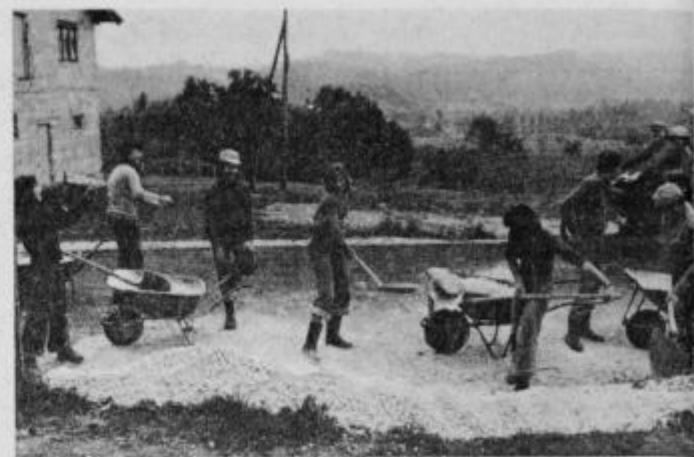
Mladi pri zakopavanju pravkar položenih vodovodnih cevi.

še posebno EMI Poljčane, EMMI Slovenska Bistrica in TOZD Granit Slovenska Bistrica. Mladi v