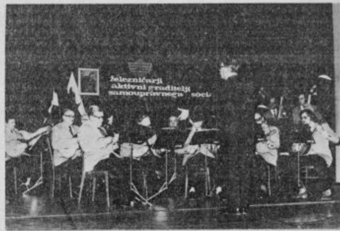
Ptujski tamburaški orkester igra železničarjem za praznik.