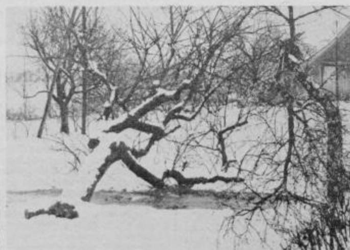
Sneg je podiral drevesa in lomil cvetoče veje