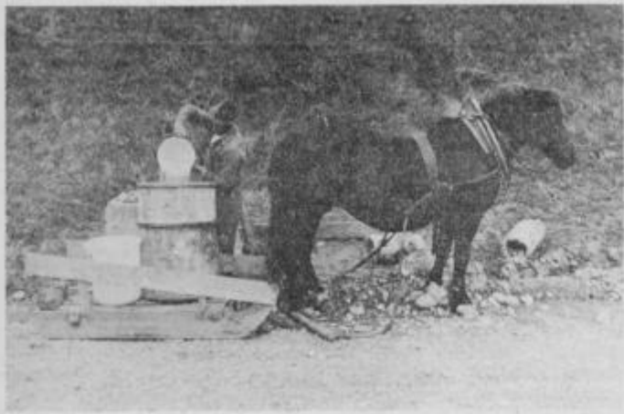
Tudi po 30 veder prelije Janez v eno kad.

in vse ostale pa prelije v kadi. Ko jih napolni, jih pokrije s polivinilom in obveže z vrvo, da se voda ne bi razlila.