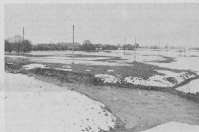
Tako se je razlila Polskava ob zadnjem deževju in sneženju, na območju med Lovrencem in Podložami

TEDNIK: Predlagamo, da bi uvodoma pojasnili namen ustanavljanja melioracijskih skupnosti ter izvedbe melioracij in komasacij. VREČKO: „V letih 1965 in 1966 je bila v ptujski občini končana regulacija Pesniške doline. Vemo, da je Pesnica v okopih, ima severni in južni robni jarek in so zato posebnosti pri urejevanju voda. Verjetno je zaradi tega nekoliko težje urediti melioracije. Če bi bila Pesnica vkopana, bi se dalo marsikaj urediti kar danes ne moremo. Seveda lahko postavimo vprašanje, zakaj je bil projekt Pesnice v okopih in ne vkopane Pesnice. Takrat so nas hidrologi opozorjali, da bi pri poglabljanju lahko prišlo ob vkopani Pesnici do