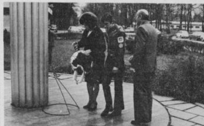
Iz slavnostne seje organov KS Kidričevo in DS TGA „Boris Kidrič“ so delegacije ponesele vence k spominskim obeležjem. Ena od delegacij je položila venec k spomeniku Borisu Kidriču.