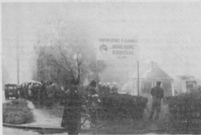
Požara ni moč gasiti brez vode, zato so hidranti nujno potrebni.

Kaj pomeni vodovod, vedo najbolj tisti, ki ga že imajo, še bolj tisti, ki so ga pred nedavnim dobili, najbolj pa vedo kaj pomeni vodovod vsekakor tisti, ki nimajo pitne vode in ki si ga tako zelo