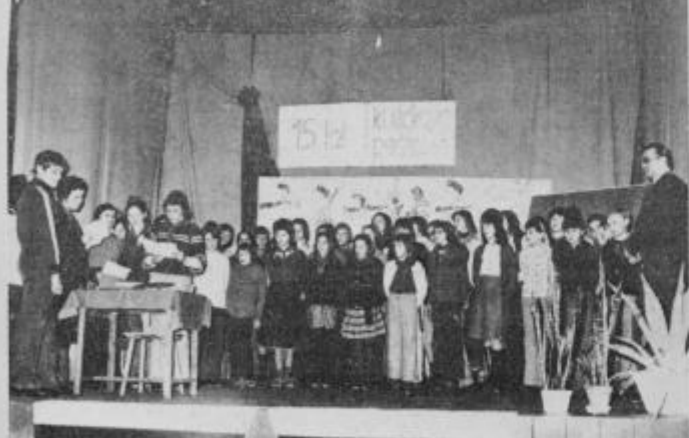
Pionirji OŠ v Juršincih so ob sprejemu kurirčkove pošte pripravili v prosvetni dvorani bogat kulturni program.

Juršinski pionirji so jo prejeli od pionirjev iz Gabernika, ob tej