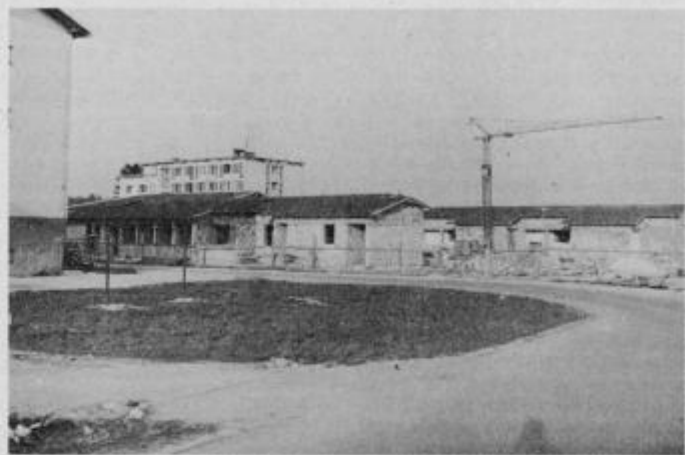
Novi otroški vrtec v Zg. Bistrici pod streho.

delom uspeli nadoknaditi zamudo, ki se je pojavila v začetni fazi del. Nov objekt bo v veliki meri razbremenil naraščajoče potrebe po organiziranem otroškem varstvu v občinskem središču Slov. Bistrici, saj bo sprejel okoli 220