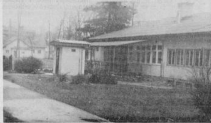
Gledano od druge strani in tudi videz je drugačen.

Vsi vemo, da mora biti takšen objekt v skladu z veljavnimi tehničnimi predpisi in normativi za gradnjo foverstnih objektov in da le tega ni mogoče zgraditi brez, z zakonom predpisane dokumentacije, kot je lokacijsko in gradbeno dovoljenje ter soglasje požarnega inšpektorja. Torej je mnenja posameznika, da je objekt tako hudo nevaren, neresnično obveščanje krajanov in napeljevanje na neobjektivno odločanje,