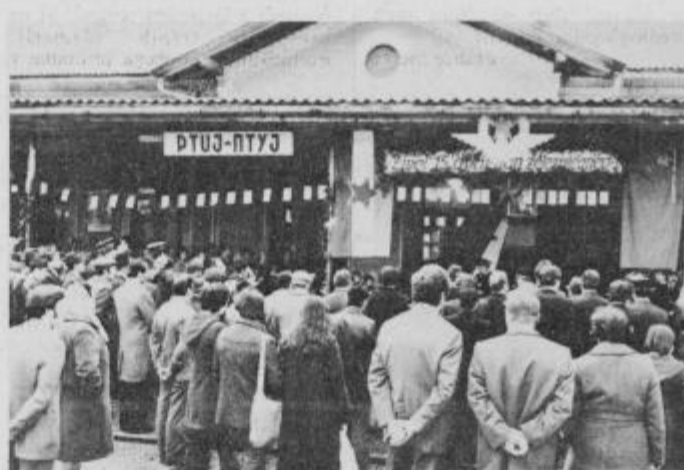
S slovesnosti ob dnevu železničarjev na železniški postaji v Ptujju

udeležilo večje število železničarjev, njihovih svojcev in drugih gostov.