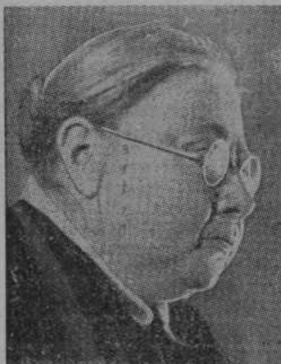
Leninova vdova Krupskaja, koje ime spravlja časopisje dnevno v zvezo z zadnjim in prihodnjim procesom v Moskvi.