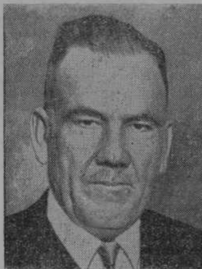
Iz Mehike v Kalifornijo pregnani predsednik Calles čaka v prognanstvu na zlom mehikanskega režima, da bi se zopet vrnil na prejšnji krvniški in trinoški prestol.