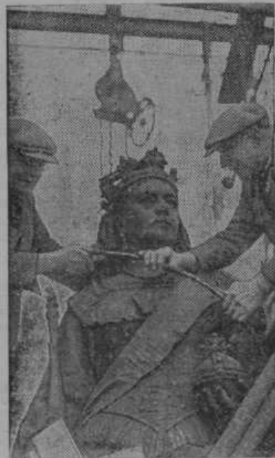
Orjaški kip angleške kraljice Viktorije ob blafrlarskem mostu v Londonu so morali nekoliko prestaviti radi prometno-tehničnih del.