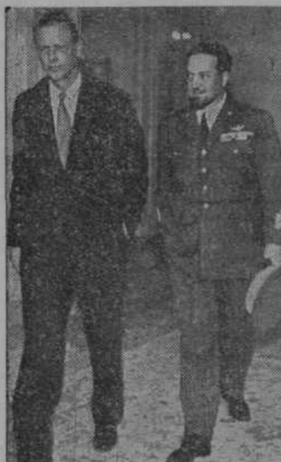
Znani ameriški letalec polkovnik Lindbergh je na svojem poletu v Egipt in Indijo obiskal italijanskega maršala Balbo, ki je že enkrat z Italijanskimi letali preletel Atlantski Ocean in na ta način počastil svetovno razstavo v Čikag!