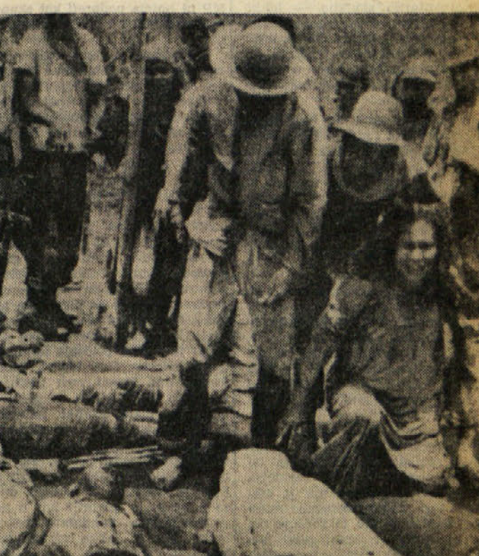
Reševalci tolažijo žensko, ki joče ob truplih svojcev, ki so zgubili življenje med bruhanjem ognjenika

Casnikarji, ki so davi leteli nad otokom, so javili, da so tri četrtine otoka pokrite z debelo plastjo vsivega pepela in da je ponekod videti samo vrhove palm. Po 36 urah bruhanja je bruhanje nekoliko pomenjalo, toda nad otokom je še vedno nevarnost nove tragedije. Vulkanologi predvidevajo novo močno eksplozijo, ki bi lahko nastala vsak trenutek. Iz previdnosti so oblasti jezera, naj zapustijo svoje domove in naj se zatečejo v bližje hribe.