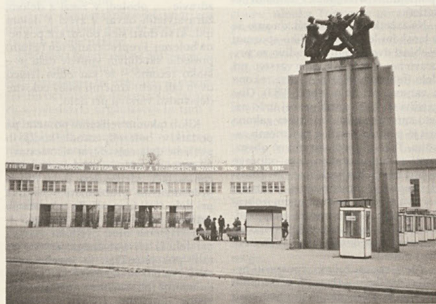
Razstavišni prostor v Brnu