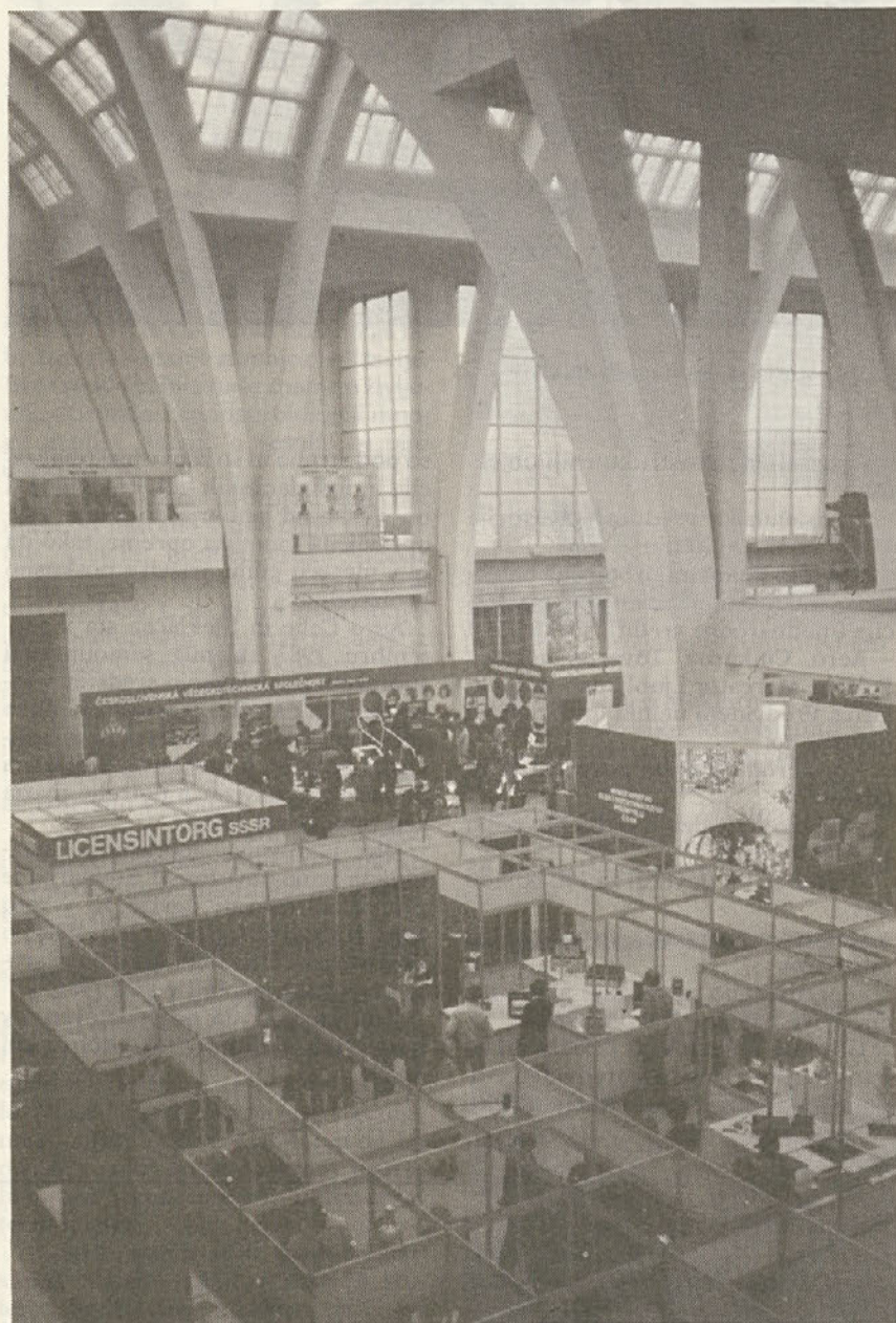
Notranjost ene od razstaviščnih dvoran

Izvršni odbor DIATI AERO je konec oktobra organiziral strokovno ekskurzijo na mednarodni sejem iznajdb in tehničnih novosti – INVEX BRNO '84. Ekskurzije se je udeležilo 44 delavcev iz vseh Aerovih toz dov.