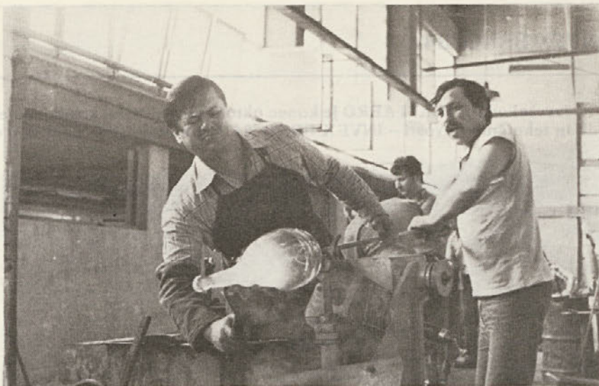
Oblikovanje steklenega izdelka