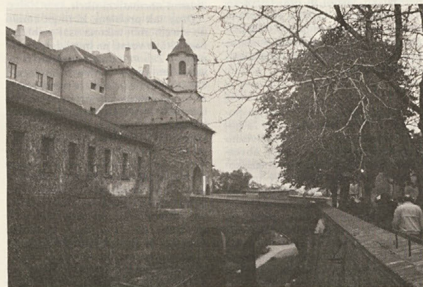
V središču – nad mestom se dviga grad Špilberg