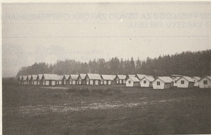
Del počitniškega naselja v Jedovnicah