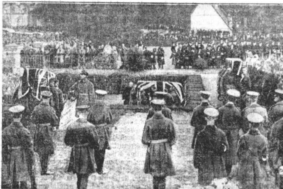
Pogreb žrtev ponesrečenega zrakoplova »R 101«.