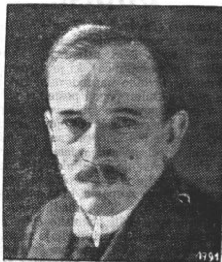
Čehoslovaški zunanji minister dr. Edvard Beneš.