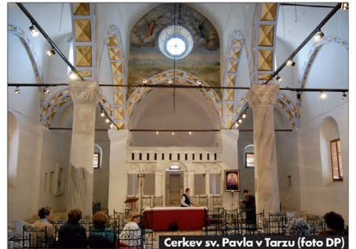
Cerkev sv. Pavla v Tarzu

V nedeljo zjutraj smo z gliserjem odpluli do pristanišča Tasaču. Vožnja je trajala več kot dve uri. Plovba je bila prijetna, ker je bilo morje mirno.