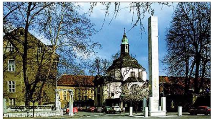
Spomenik, ki so ga na trgu Francoske revolucije postavili ob 120. obletnici ustanovitve Ilirskih provinc jeseni 1929 po načrtih arhitekta Jožeta Plečnika.