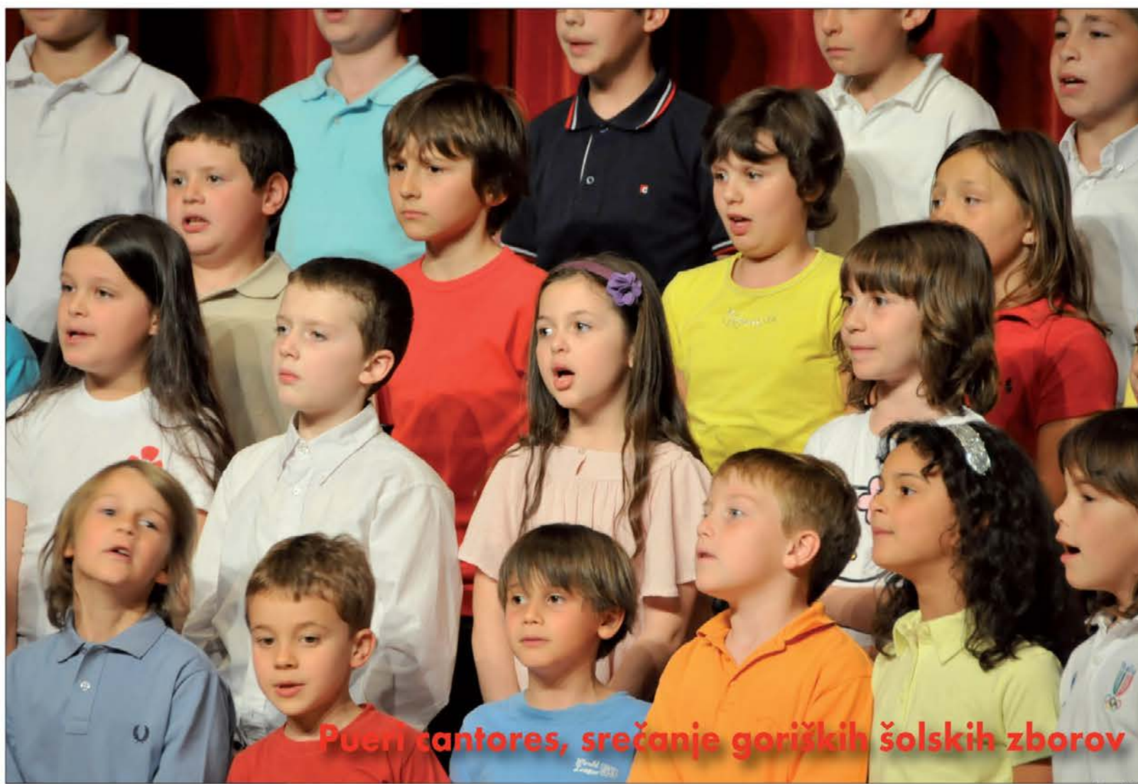
Poen cantores, srečanje goriških šolskih zborov

Kaj lahko danes vidimo v Ilirskih provincah? Nedvomno je tu zrasla ideja, ki jo je sicer kasneje zopet v okviru Avstrije leta 1848 obsegala zahteva po Zedinjeni Sloveniji. Ta pa že napoveduje uresničitev zamisli o slovenski državi. Danes je to zgodovinska stvarnost. Slovenija je danes v Evropski uniji, katere enakopraven član je že od leta 2004. In tudi v Sloveniji se uresničuje gesla francoske revolucije in napoleonske vlade, saj so enakost, bratstvo in svoboda temelj vsake moderne demokratične države in družbe.