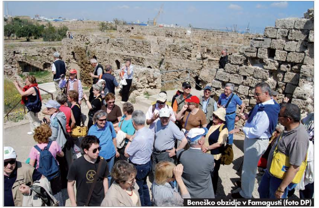
Beneško obzidje v Famagusti

niki, vstop je zato brezplačen. Nadaljevali smo pot do Mersina. Naslednje jutro bi morali odpluti z gliserjem iz Tasaču v Kyrenijo na Ciper, toda zaradi močnega vetra in razburkanega morja nismo mogli odpotovati. Z agencijo smo se dogovorili, da nam poskrbijo letalski prevoz, zato smo se morali vrniti v Adano, tj. približno 250 km in od tam smo odleteli v Nikozijo na Ciper. Uradno ima ime Repu-