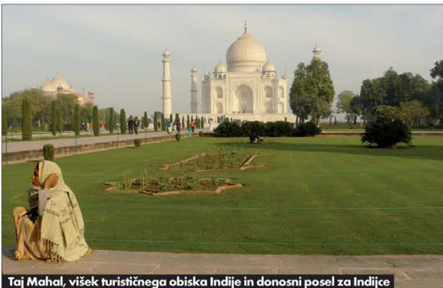
Taj Mahal, višek turističnega obiska Indije in donosni posel za Indijce

Indija, ekonomska velesila Indija je danes po vseh ekonomskih kazalcih svetovna velesila.