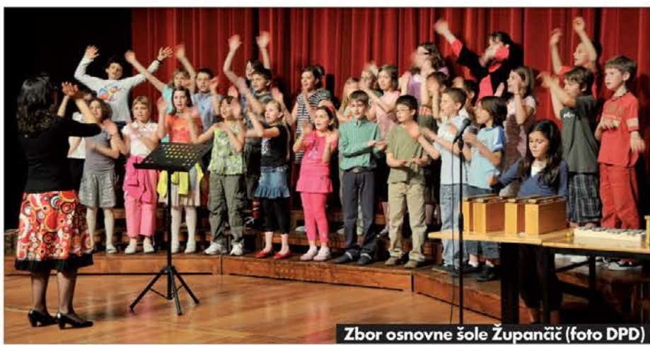
Zbor osnovne šole Župančič

Letošnja izvedba zborovske revije goriških šolskih zborov Pueri cantores, ki jo je že petič organizirala goriška srednja šola Locchi, je v četrtek in petek, 14. in 15. maja, prav lepo uspela. Kot so uvodoma povedali prireditelji, gre za didaktično-kulturno pobudo, namenjeno osnovnim in srednjim šolam goriške pokrajine, ki želi biti priložnost za srečanje in soočanje med otroki in mladimi italijanskega in slovenskega jezika, hkrati pa tudi tke vezi med njihovimi mentorji, šolami in glasbenimi ustanovami. V veliki dvorani Kulturnega centra Lojze Bratuž so otroci, starši in drugi sorodniki v vedrem razpoloženju spremljali nastop številnih otrok, ki so se zvrstili na odru. Prvi popoldan so uvedli otroci osnovne šole Dante Alighieri iz Turjaka z rumenimi