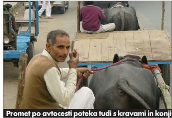
Promet po avtocesti poteka tudi s kravami in konji

je, da je bila indijska ekonomija manj pod udarom ekonomskega pekla, ki je prizadel celoten svet. 11. september na Wall Streetu je