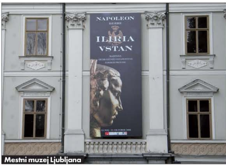
Mestni muzej Ljubljana

bljani, Bovcu, Pivki in Parizu. Omenjamo jih le nekaj. Francoski inštitut Charles Nodier v Ljubljani bo organiziral francosko-slovenski kolokvij Evropa in nacionalne identitete - od Napoleona do Evropske unije, na katerem bo z referatami sodelovalo nekaj več kot trideset predavateljev iz Slovenije, Francije, Velike Britanije, Avstrije, Rusije, Italije, Nemčije in Hrvaške. Njihova znanstvena dognanja bodo objavljena v posebnem zborniku. Že oktobra bodo odprli še eno veliko razstavo, in sicer v prostorih Narodnega muzeja Slovenije in z naslovom Pod Napoleonovim orlom - dvestoletnica Ilirskih provinc. Razstavo bodo leta 2010 prenesli tudi v Vojni muzej v