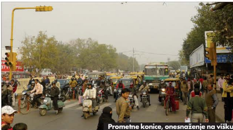
Prometne konice, onesnaženje na višku

stanju indijske ekonomije se torej močno razlikujejo, dejstvo pa