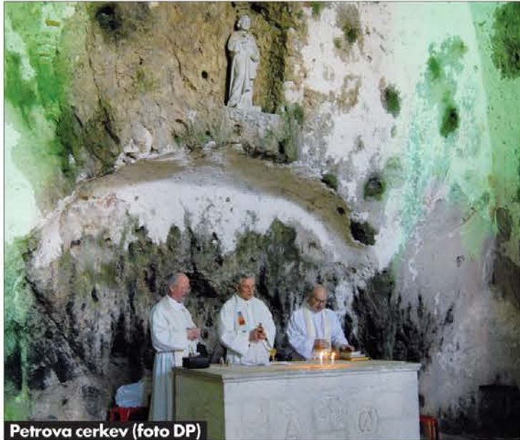
Petrova cerkev

mašo. Spominjali smo se, kako so se zbirali tu prvi Jezusovi učenci, katere so začeli imenovati kristjane. Tu je deloval najprej sv. Barnaba, nato tudi sv. Pavel. Tu je bil doma tudi evangelist sv. Luka, kot zatrjuje sv. Hieronim. Ogledali smo si tudi muzej Hatay, kjer je prikazana zgodovina Antiohije.