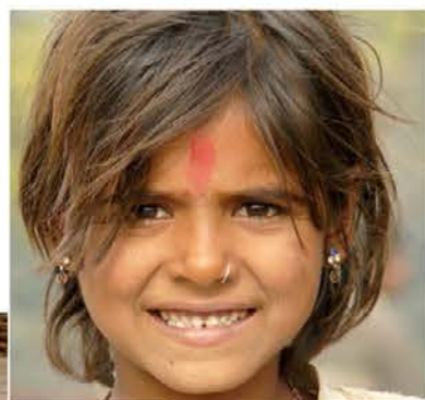
Nasmeljani otroški obraz, kljub vsemu

Po podatkih IMF, Svetovne banke, je Indija dvanajsta sila po velikosti BDP-ja, ki se giblje okoli