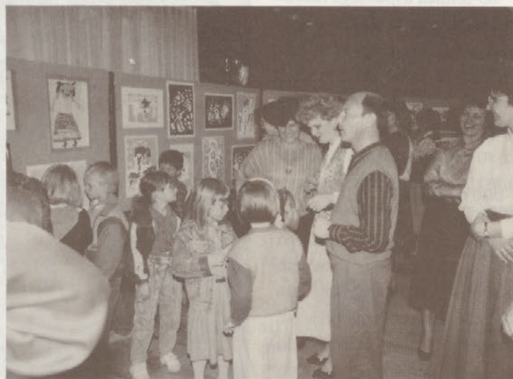
Trenutek z otvoritve razstave otrok VVO Ptuj, ki je bila 22. marca 1990 v avli poslovnega centra Perutnine

Z razstavo smo želeli prikazati preko različnih tehnik in različnih tem tudi razvoj otrokove likovne ustvarjalnosti od stopnje čečkanja do stopnje simboličnega oziroma