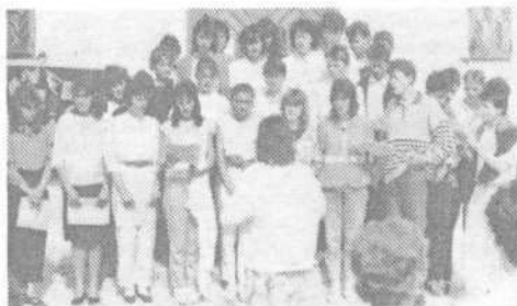
Polhograjski mladinski mešani pevski zbor