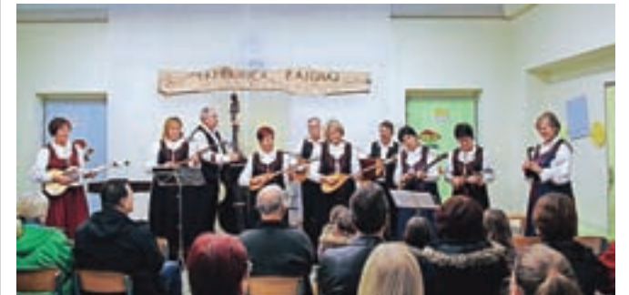
Člani Tamburaške skupine Bisernica

vanj, danes pa predvsem aktivno nastopa in se udeležuje koncertov, so na tamburice začeli igrati med leti 1958 in 1970. Po obdobju krajših prekinitev sedaj uspešno delujejo že šestnajsto leto. Njihov glasbeni repertoar zajema raznovrstne skladbe, vse od narodnih do klasičnih. Poleg klasičnih so v Tunjicah