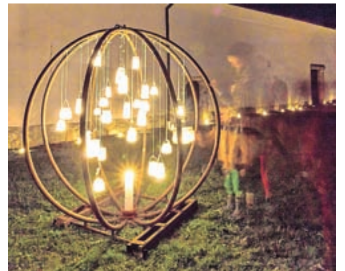
Številni obiskovalci so občudovali domiselne ognjene postavitve.