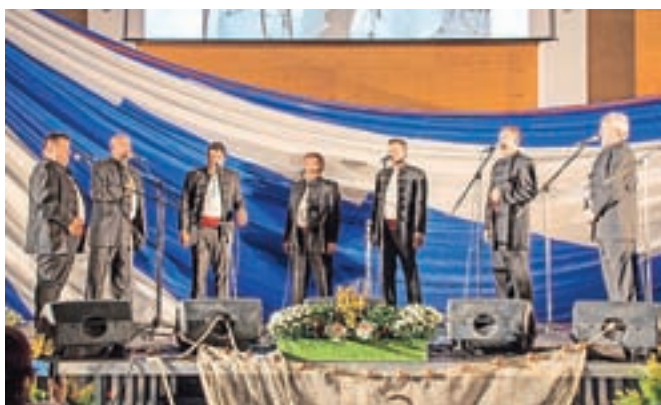
Klapi Mali grad iz Kamnika

Klape so s svojimi enakozvočnimi, včasih nostalgичnimi, drugič šaljivimi pesmimi poskrbele, da bo teh nekaj dolgih mesecev, ki nas spet ločijo od poletja in brezskrbnih počitniških dni ob morju, minilo hitreje. S svojimi pesmimi so občinstvo popeljale vzdolž jadranske obale in če je kdo zaprl oči, si je lahko predstavljal, da je na kakšnem obmoškem glasbenem festivalu. Manjkalo je le morje.