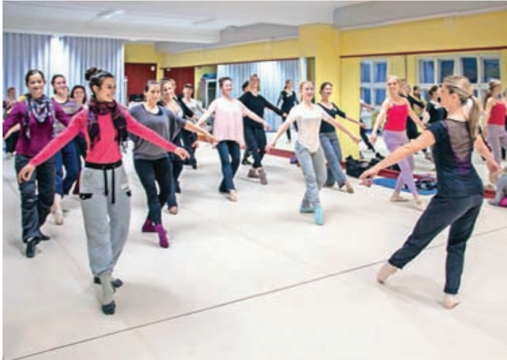
Baletne plesalke v prenovljeni mali dvorani Doma kulture Kamnik

Kamnik – Mala dvorana Doma kulture Kamnik je bila potrebna obnove že precej časa. V njej vsakodnevno plešejo učenke baleta Glasbene šole Kamnik, prostor uporablja tudi Folklorna skupina Kamnik, KD Sandžak, v njem se pleše, poučuje in telovadi. Letos je Občina Kamnik za najnujnejša investicijsko-vzdrževalna dela in opremo v Domu kulture Kamnik namenila 60 tisoč evrov, z deli pa se je začelo v sredini oktobra. Kaj je novega? V mali dvorani in sanitarijah so zamenjali luči, položili so OSB-plošče in baletni pod v mali dvorani, kjer so tudi uredili garderobo, "harmonika" vrata, namestili zavese in roloje ter nabavili stole za potrebe male dvorane. Poleg tega so prepleskali pritličje, stopnišče, hodnik v prvem nadstropju in malo dvorano. Vsa dela še niso zaključena, ker morajo izvajalci svoje delo prilagoditi glede na zasedenost Doma kulture Kamnik. Za potrebe glavne dvorane in kino kluba je v postopku tudi nakup in dobava opreme – projekcijsko platno, oprema za scensko in drugo razsvetljavo. Dela so se izvajala tudi na podstrešju in v okolici kulturnega hrama. Z investicijsko-vzdrževalnimi deli v