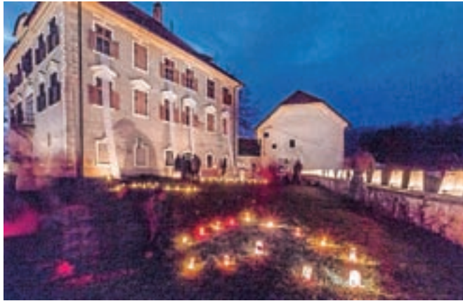
Grad Zaprice je osvetlilo osemsto sveč.

Kamnik – Sodelavci Mladinskega centra Kotlovnica, ki že štiri leta stojijo za Ognjeno Veroniko, vsako leto odkrivajo nove prostore našega mesta, ki ga za trenutek občanom predstavijo v drugačni luči. Po dogajanju na pobojču Malega gradu, Keršmančevem parku in Parku Evropa so letos z odličnim sodelovanjem Medobčinskega muzeja Kamnik povabili obiskovalce na umirjen sprehod, pravljčni večer in ogled muzejskih zbirk z drugega zornega kota na grad Zaprice. Priprave na Ognjeno Veroniko potekajo vsako leto dober teden, najbolj intenzivno seveda zadnji dan, ko je petnajst sodelujočih iz MC Kotlovnica na območju gra-