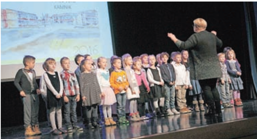
Pevci Otroškega pevskega zbora Verine zvezdice