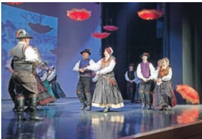
Folklorna skupina Kamnik je ob praznovanju jubileja pripravila bogat plesni in glasbeni večer z naslovom Ples in glasba izpod kamniških planin.