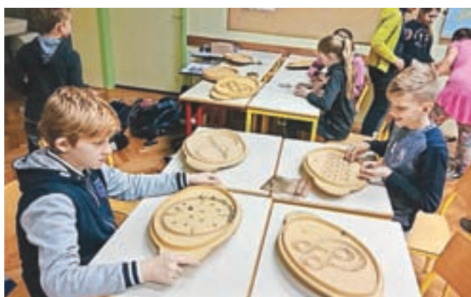
Spoznavali smo tudi igre za slepe.

Ob koncu dneva smo bili vsi enotni, da je spoštovanje res pomembno. Z njim dajemo drugim vrednost in v njih vidimo sočloveka. Vsak človek ima ime in zgodbo. Spoštujmo vsakogar in povsod. To je majhen korak za vsakega od nas in velik korak za pozitivne spremembe in boljše življenje.