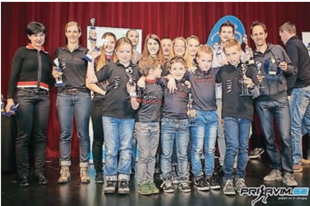
Najboljši člani kamniškega Calcit Bike Teama