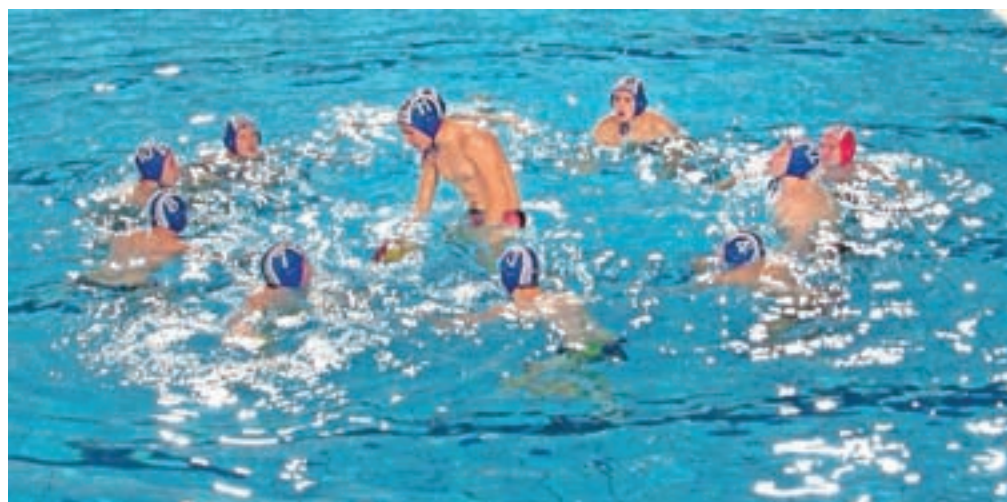
Na državnih prvenstvih bodo kmalu aktivne vse ekipe kamniškega vaterpolskega društva.

Predzadnji in zadnji konec tedna v novembru so bili aktivni še najmlajši in člani. Člani so v predtekmovanju pokala Slovenije igrali proti AVK Branik; zmaga z 19:4 jih je peljala v polfinale. Nasprotnik močno pomlajene kamniške ekipe je bil Slovan Ljubljana, končni rezultat pa 25:3. Povratna tekma bo jutri, 3. decembra. Zadnja je vodo