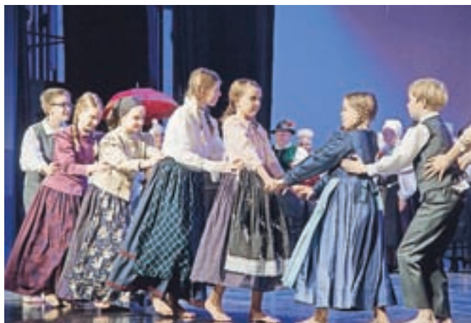
Pomembna naloga folklornih skupin je približevanje ljudskega izročila mladim. Na fotografiji Otroška folklorna skupina Marije Vere.

Tudi zato, ker se folklor ne ozira le v preteklost, temveč pogumno koraka v prihodnost, je na mestu naslovni pozdrav zapisa Toneta Ftičarja ob praznovanju: »Rdeč nagelj, zelen rožmarin: v potnico, ne le v spomin!«