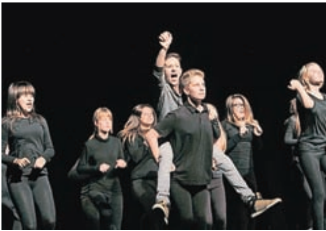
Prizor iz muzikla Martin Krpan.com