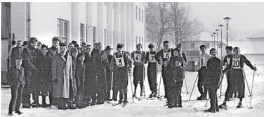
Start tekme smučarskih tekačev (najverjetneje leta 1956) pred današnjim Domom kulture Kamnik

Iz njegovih zapisov lahko razberemo vrsto zanimivosti, kot denimo to, da sta bila start in cilj tekem za smučarske tekače na Glavnem trgu, kasneje pa pred današnjim Domom kulture Kamnik, da so smučali tudi na Menini planini, da so mladi na Malih poljanah 'sezidali' preprosto skakalnico iz snega in na njej skakali po deset, petnajst metrov daleč ter se tako kalili za večje skakalnice, in da so tudi nekdanj že imeli težave z zelenimi zimami. »V letih 1935,