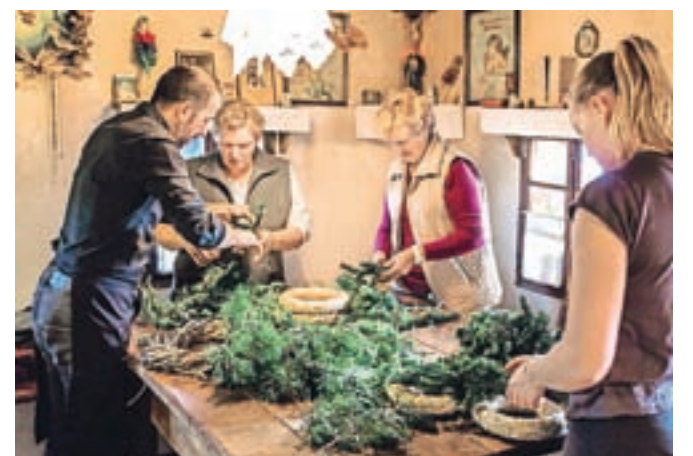
Budnarjeva domačija je bila znova v znamenju adventnih venčkov.

koncu še izdelave dekoracije. Pri adventnih venčkih, simbolu večnosti, je še vedno moderno in priljubljeno vse, kar lahko najdemo v naravi, pomembno pa je tudi, da domišljiji pustimo prosto pot. Razveseljivo je, da se znova vse več ljudi zaveda pomena ohranjanja božične tradicije, ročnega dela in lastnega truda, zato je bilo v Budnarjevi domačiji že moč začutiti božično vzdušje in ponos udeleženk ob pogledu na lične vence, ki krasijo domove štiri adventne nedelje.