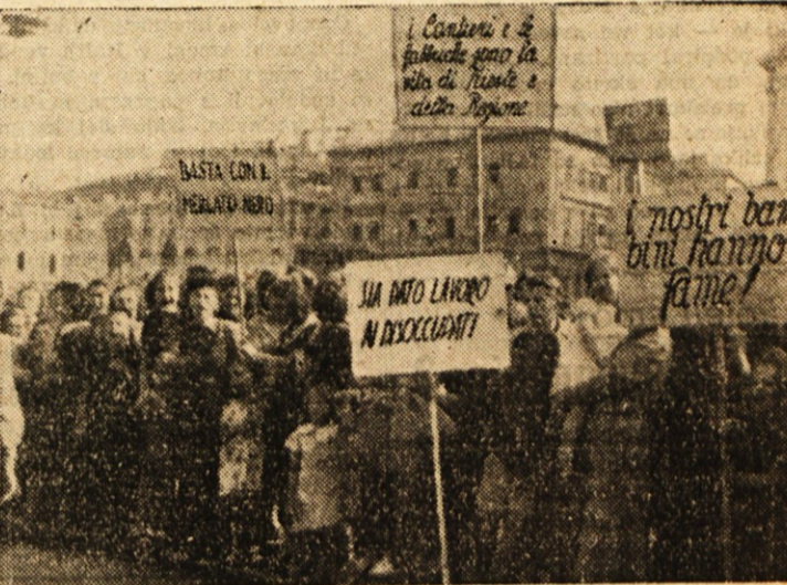
Tržaške žene zahtevajo kruha in dela!

Zeni sta jim rekli, če ima ZVU svoje vzroke, da ne začne obnavljati in ne da brezposelnim dela, imata tudi ljudstvo svoje razloge, da protestira. Ljudstvo že leto dni prenaša le nevdružne prilike, toda vsako potrpljenje ima svoje meje. Če ZVU ne more dati dela, naj vsaj preskrbi za pravično delitev živil. Ni dovolj, da so izložbe polne blaga in dobrot, če pa si jih revni sloji ne morejo nabaviti. Častniki so jima odgovorili, da so po vsem svetu težko, da je v Ameriki s milijonov brezposelnih (razlog, da morajo biti tudi prisiljeni) in da so prišli v primeru z drugimi področji tu še konkretno, da se bo dalo kaj ukreniti. Končno so proslili delegatki, naj jih žene še vneprej obve-