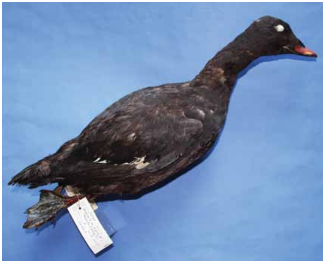
Slika 16: Ohranjeni primerek samca beloliske (Melanitta fusca) iz Zoisove ornitološke zbirke, ki je bil pridobljen med letoma 1796 in 1797 v Ljubljani.

Primerek brani Dunajski naravoslovni muzej.