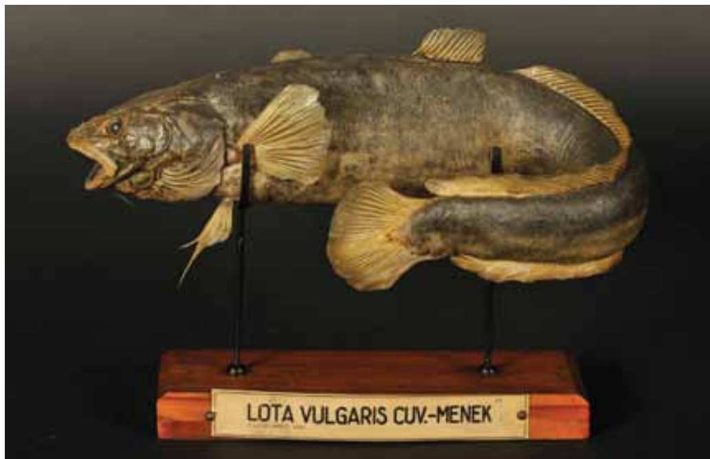
Slika 12: Današnji zapis imena: menek (Lota lota).