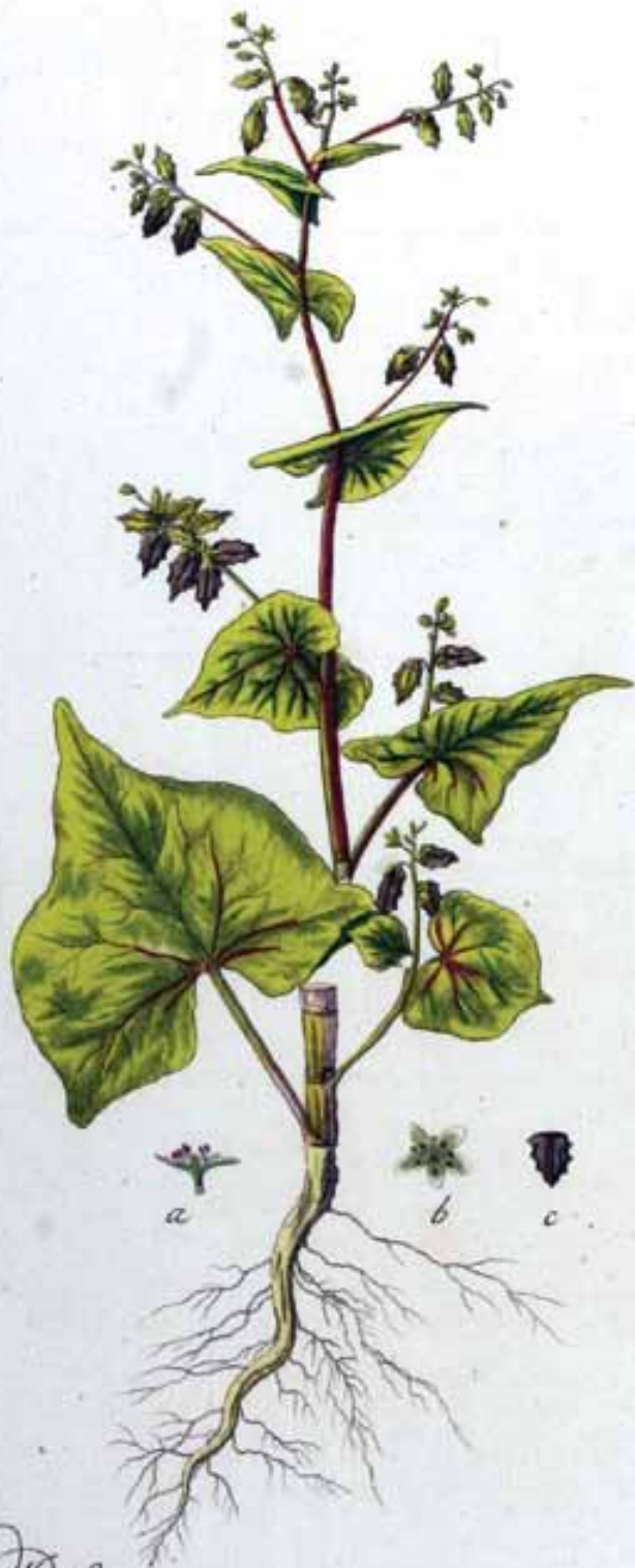
Polygonum tataricum, 598.

Slika 17: Prav Sigismondo Zois naj bi na Kranjskem uvedel gojenje proti mrazu bolj odporne tatarske ajde ( Fagopyrum tataricum ), ki so jo Mislinjčani po njem imenovali kar »Cojzla«.