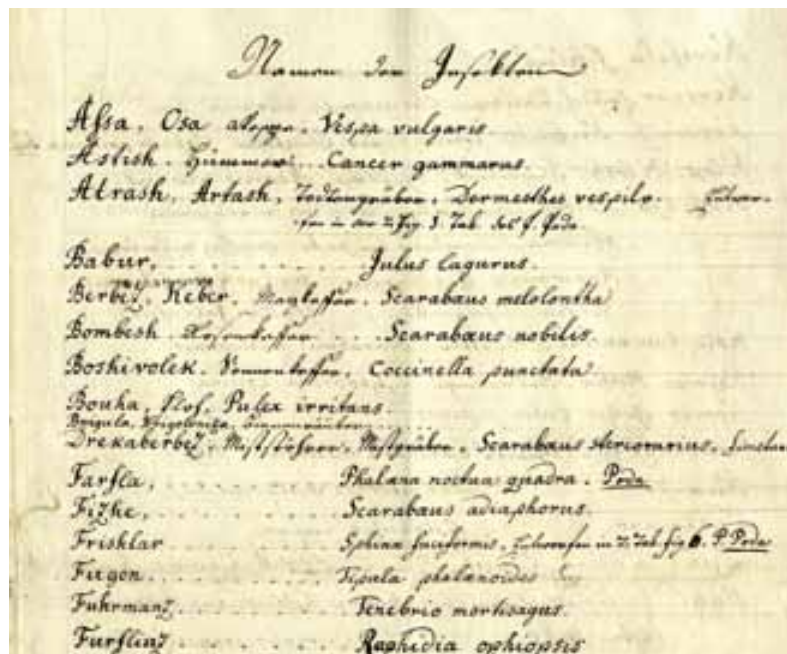
Slika 14: Priloga Insekten je sestavljena iz slovenskih nemških in znanstvenih imen živali. Navedenih je 105 zapisov imen, ponekod so dopisani tudi avtorji opisa.

Barona Sigismonda (Žige) Zoisa lahko štejemo za enega od prvih ornitologov, torej preučevalcev ptic, na Slovenskem. Na tem področju je bil Zoisov veliki vzornik idrijski naravoslovec Joannes Antonius Scopoli. Čeprav se nista poznala osebno, je Scopolijev popis ptic Kranjske z dodanimi nekaterimi slovenskimi imeni iz leta 1769 Zoisu rabil kot ključni vir za njegova raziskovanja ptic. Zoisov