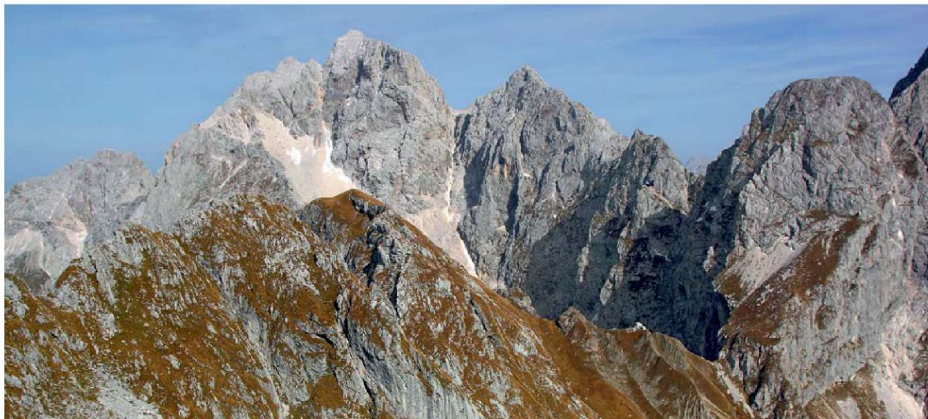
Travnati Plešivec, za njim Jalovec

Oprema: Običajna oprema za visokogorje, čelada, oprema za samovarovanje.