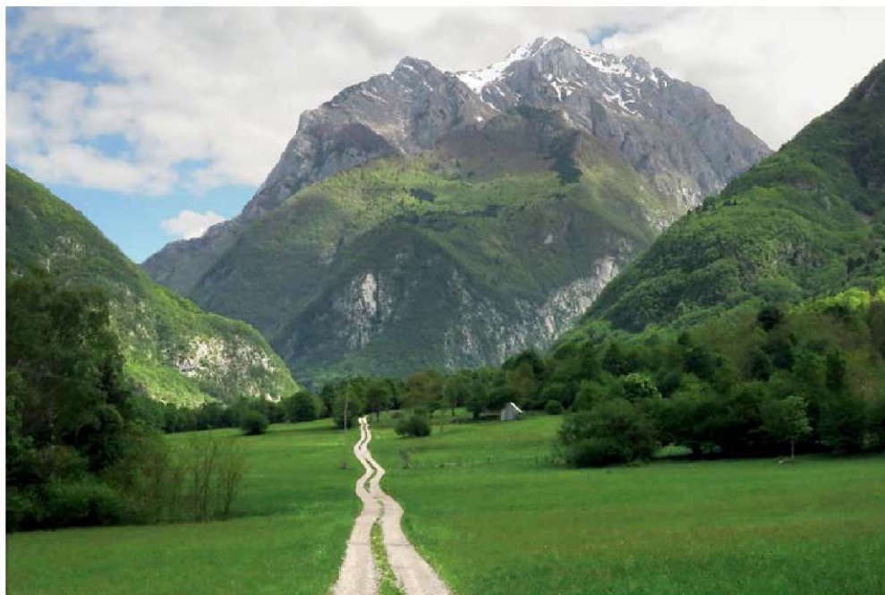
Vrh Krnice

za velikopotezno turo, kjer moramo biti tako tehnično kot tudi kondicijsko dobro podkovani. Zhašili se bomo v odročnem in divjem svetu, kjer tudi prelet orla ne bo prav nič neobičajen.