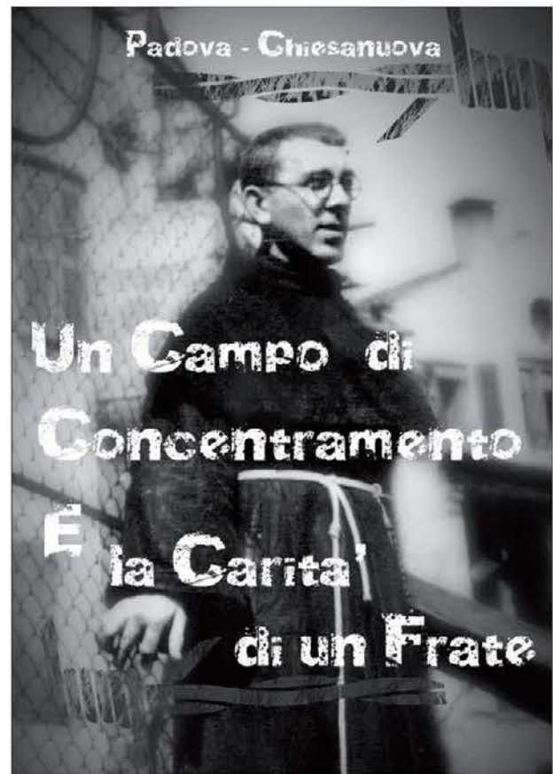
Padova - Chiesanuova