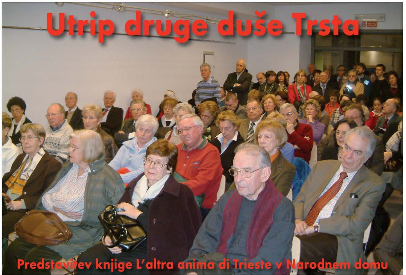
Predstavitelj knjige L'altra anima di Trieste v Narodnem domu

Kaj storiti? Edino jamstvo za večjo nataliteto bi bilo okrepitev vloge družine, tiste, ki temelji na trajni zvezi med možem in ženo. Vsi, verni in neverni, ki želijo imeti človeka vredno prihodnosti, imajo etično dolžnost podpreti družino. Druge poti ni! Še enkrat je imel prav poljski papež, ki je trdil, da brez družine ni človeške prihodnosti. Za t. i. "družinske politike" ne more zadoščati 2,1% bruto notranjega proizvoda (evropsko povprečje) ali, še slabše, 1,2% (že spet Italija!). Družina je namreč subjekt javne koristi, motor razvoja in prihodnosti. Politika bi morala z davčnimi olajšavami, fleksibilnimi urniki in zlasti z večjo pozornostjo do zaposlenih mater omogočiti družinam, da si "privoščijo" toliko otrok, kolikor si jih z odgovornostjo želijo, ne da bi zaradi tega drsele v najrevnejši družbeni sloj, kot se žal dogaja številnim. Zato bomo do onemoglosti ponavljali: nosečnost ni bolezen, ampak blagoslov! Otroci niso "neznosno breme" ali, kot trdijo ciniki, "razlog za onesnaževanje narave". So velik dar za vsako družino in družbo, če le hočemo obstati Slovenci, Italijani, Avstrijci, Nemci, Francozi itd. itd.