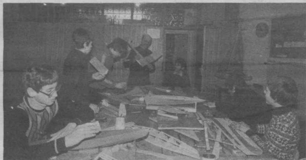
Mladi modelarji so v počitniških dneh delali makete ladij, jadrnice, motorne čolne in letala.