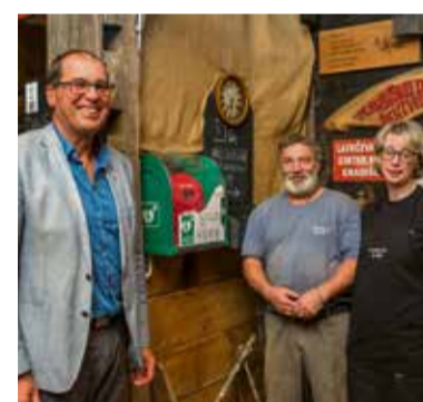
Novi defibrilator tudi na Gradišču