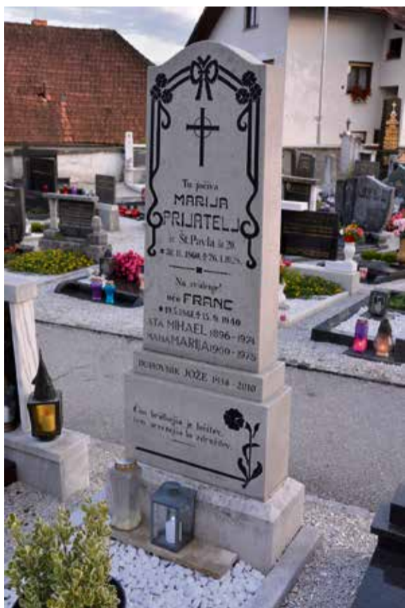
Oblika nagrobnika lahko priča o posebnem stilskem obdobju, v katerem je bil izdelan. Primer secesijskega nagrobnika z šentviškega pokopališča.

V predgovoru zbornika Pokopališča v Evropi. Zgodovinska dediščina, ki jo je treba spoznati in ohraniti (2004) je zapisano, da so pokopališča zelo pomembni in svojevrstni arhitekturni kompleksi. So osupljive pripovedi o zgodovini mest in celih narodov. »Zaradi tega bi morala pokopališča veljati za osrednje elemente evropske kulturne dediščine na področju likovne umetnosti, zgodovine in antropologije, vendar pa temu ni tako.« K večjemu zavedanju o pomenu pokopališč je bistveno pripomoglo Združenje kulturno pomembnih evropskih pokopališč (ASCE), ki je bilo ustanovljeno leta 2001. Združenje spodbuja zavest o kulturno zgodovinskem pomenu pokopališč od leta 2004 dalje tudi z Dnevi dediščine evropskih pokopališč. Ti navadno potekajo vsako leto konec maja in v začetku junija. Pri nas na primer so takrat organizirana vodstva po Žalah in po glavnem