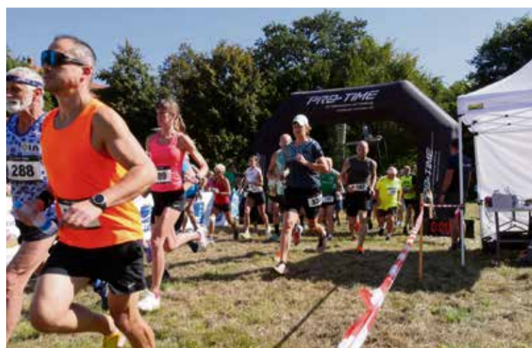
Prejemnice in prejemniki pokalov in medalj