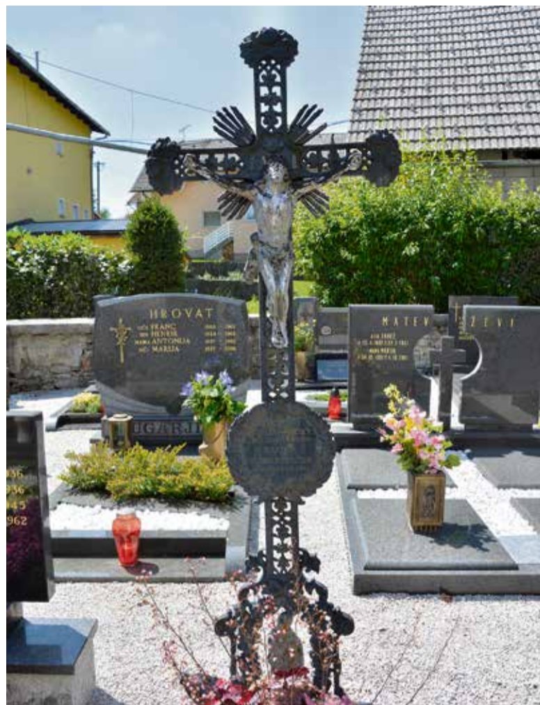
Primer litoželeznega nagrobnega križa iz Ambrusa, ki je bil izdelan v železolivarni na Dvoru pri Žužemberku. Eden redkih še ohranjenih na naših pokopališčih.

»Upravitelj daje soglasja za postavitev, popravo, odstranitev spomenikov in drugih nagrobnih obeležij, razen ko gre za nagrobnike ali obeležja, ki so kulturna