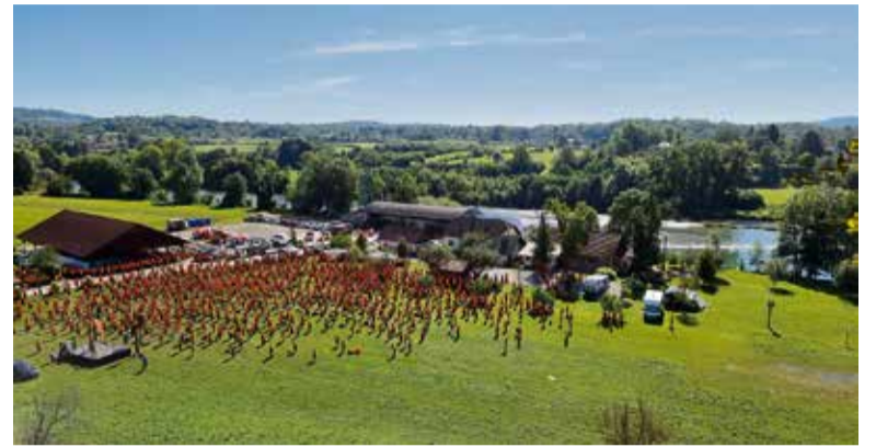
Prizorišče srečanja