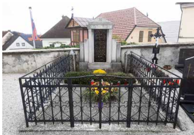
Socialne razlike so se odražale na pokopališčih z velikostjo in obliko grobov. Primer grobnice premožne trgovske družine Rojec iz Šentvida pri Stični.