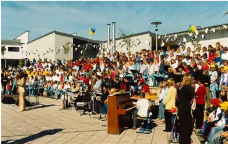
Svečan kulturni program ob otvoritvi šole

Poleg oddelitve pa se je v teh 20-ih letih dogajalo tako zelo veliko. Naj vam obudimo vsaj nekaj spominov in sprememb. V teh 20-ih letih smo presedlali z 8-letke na 9-letko, v organizacijo po triadah, v šolo s številnimi programi šole v naravi, tekmovanji, projekti, izleti in izmenjavami v tujino, izbirnimi predmeti. Doživeli smo zaprtje države zaradi kuge 21. stoletja, korone, ki nam je pošteno prevetrila vrednote in jasno postavila naše prioritete. Hkrati nas je naučila mnogo novega. Od spoznavanja in proučevanja Worda, Excela in Powerpointa smo presedlali na spoznavanje videokonferenc preko Zooma, Teamsov, Skypa in drugih podobnih programov. Če je bil e-naslov do takrat rezerviran samo za zaposlene, smo ga v tem času vsi uporabniki šole (da, tudi učenci) vneto in s pridom uporabljali. Učiteljica računalništva je bila pred več kot 20-imi leti lahko tudi učiteljica slovenščine, ki je obiskala hitri tečaj računalništva. Danes nas s svojim znanjem in spretnostmi razvaja prav za računalniško vedo izobražen računalnikar. Mnoge interesne dejavnosti so postale izbiri-