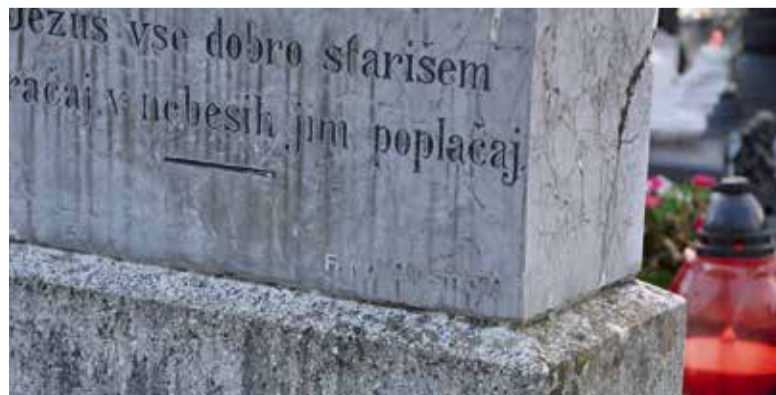
Podpis kamnoseka Franca Novaka iz Stične, ki se je podpisal na svoj izdelki.