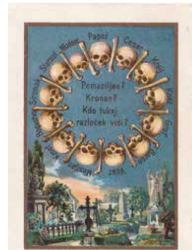
Nabožna podobica iz okoli 1930 o pokopališču kot prostoru enakosti vseh družbenih slojev. Hrani Muzej krščanstva na Slovenskem.