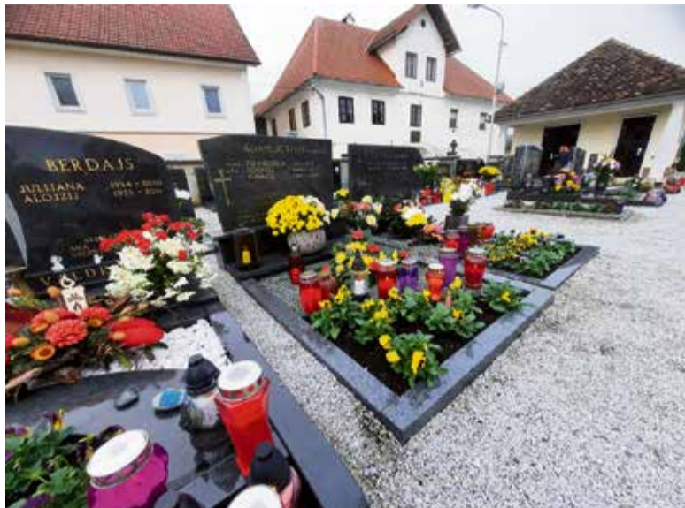
S svečami in rožami okrašeni grobovi na dan vseh svetih.

V preteklosti je bila zakoreninjena vera, da v času vseh svetih duše rajnih sedijo na grobovih in gledajo kdo jih obišče. Ko zvečer zazvo-