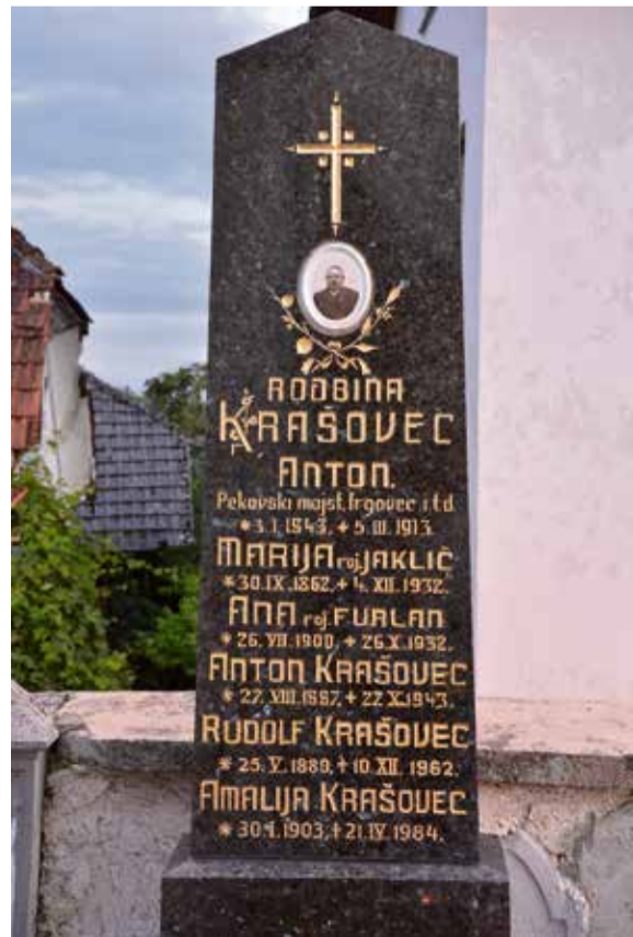
Na posameznih nagrobnikih je mogoče prepoznati poklic pokojnega. Primer znamenite pekovske družine iz Šentvida pri Stični.

mariborskem pokopališču Dobrava. Obe pokopališči sta vključeni v omenjeno združenje.