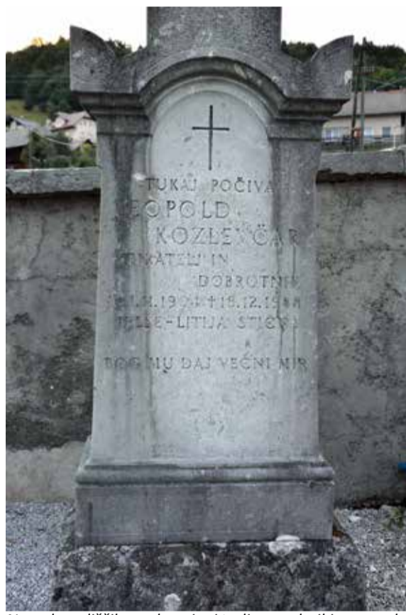
Na pokopališčih so ohranjeni tudi nagrobniki pomembnih in znanih osebnosti. Primer nagrobnika Leopolda Kozlevčarja na stiškem pokopališču.