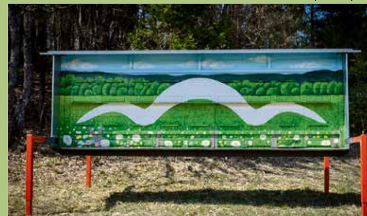
Primer poslikave čebelnjaka z značilno valovnico, ki ponazarja valovito in razgibano pokrajino naše občine