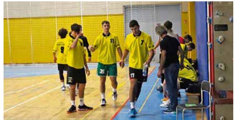
Naši dijaki-rokometasi med minuto odmora.

Naši fantje so v svoji predtekmovalni skupini zmagali in se tako uvrstili v polfinale. Tam so imeli precej smole, saj so tekmo po neodločenem izidu po rednem delu izgubili šele po streljanju kazenskih strelcev. Njihov nasprotnik je bila ekipa Šolskega centra Krško Sevnica. Ta poraz jih je precej potrl, tako da so pod vtisom tega poraza izgubili še tekmo za 3. mesto. Kljub temu pa je 4. mesto na