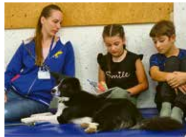
Psička Gaja na obisku.

Branje je vseživljenjski proces in tudi za branje velja, da vaja dela mojstra. Mesec branja nas opominja, kako pomembno je branje, saj spodbuja otrokov spoznavni in čustveni razvoj ter vpliva na razvoj možganskih celic. Svoj odnos do knjig in bralcev moramo bogatiti, saj tako bogatimo tudi svoje življenje – z gledanjem najmlajšim pa je tisto, k čemur moramo večkrat načrtno pristopiti, da imajo izkušnjo, o kateri bodo lahko nekoč pripovedovali drugim.