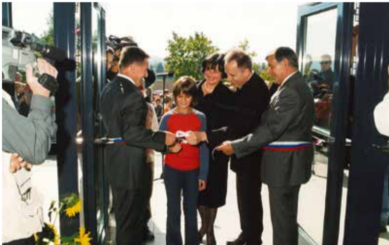
Slavna otvoritev šole, september 2003

ni predmeti, mobilni telefoni so bili nujni za uporabo podjetnikov, kar naenkrat pa so postali nujno sredstvo komunikacije tudi med starši in otroki, a hkrati tudi past za duševno zdravje otrok (pa tudi odraslih), saj je pametni telefon skoraj popolnoma enak prenosnemu računalniku, ki nam jemlje tako dragoceni čas v hitro spreminjajočem se svetu. Navadne zelene table so prešle v belo, nato smo lahko računalnik povezali s projektorjem ali pa kar z interaktivno tablo, ki omogoča direktno povezovanje s telefonom in ustvarjanje kreativnih zapiskov pred očmi učencev. Streha nove šole je dobila novo pokrivalo: zeleno, novodobno tehnologijo – sončne celice. Ogravamo se z biomaso.