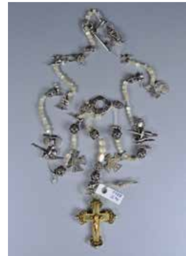
Rožni venec ali molek iz 17. stoletja iz Maria Zell na avstrijskem Štajerskem. Hrani Muzej krščanstva na Slovenskem.