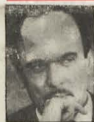
Dr. Janez Drnovšek

SFRJ iz Slovenije dokaj presenetljivo izvolili dr. Janeza Drnovška. Po teh podatkih je dr. Drnovšek (upoštevanih še ni sedem odstotkov glasovnic) dobil 57 odstotkov glasov, inženir