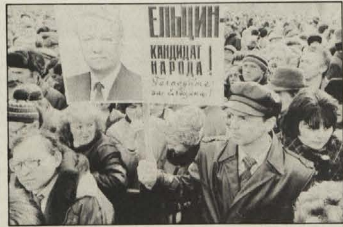
Veliki zmagovalec v Moskvi: Boris Jeljcin ima veliko podporo s strani ljudstva; dobil je skoraj 90 % glasov.

TEL AVIV. – Zaradi zgodovine židovskega naroda si Izrael ne sme privoščiti nadvlade nad drugimi narodi, je na zborovanju v Jeruzalemu dejal prvi podpredsednik izraelske vlade Shimon Perez. Dejal je tudi, da je nastopil čas, da Izrael dokončno reši spor s Palestinci.