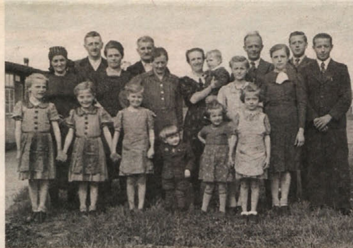
V Taborišču Frauenaurach – Tri družine, ki so bile izseljene iz Podsinsje vasi