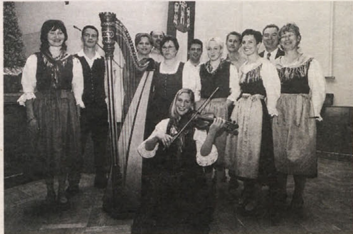
Člani skupin, ki so oblikovali četrtkov večer

Letošnji teden je potekal v Velikovecu, torej na mešanem jezikovnem območju, rane iz polpretekle zgodovine tega kraja pa so še povsod prisotne.