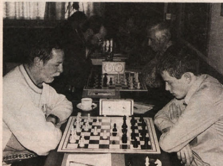
Šahisti SŠZ (leva vrsta) in SŠK »Obir« (desna vrsta) so osvojili peto in šesto mesto v podligi