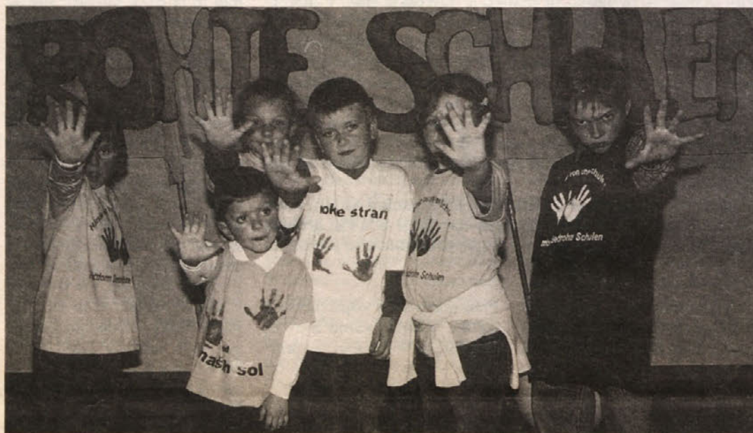
Otroci so bili oblečeni v majice z napisom: roke stran od naših šol

Pospredsednik DŠS Rudolf Altersberger je na zborovanju tudi povedal, da grozi dvojezični LŠ Libuče (sedaj obiskuje šolo 20 učencev in učenk) konec samostojnosti. Nadalje je dejal, da bo platforma in v nej vključeni starši in učitelji z akcijami v smislu osveščanja javnosti nadaljevala. M. Š.