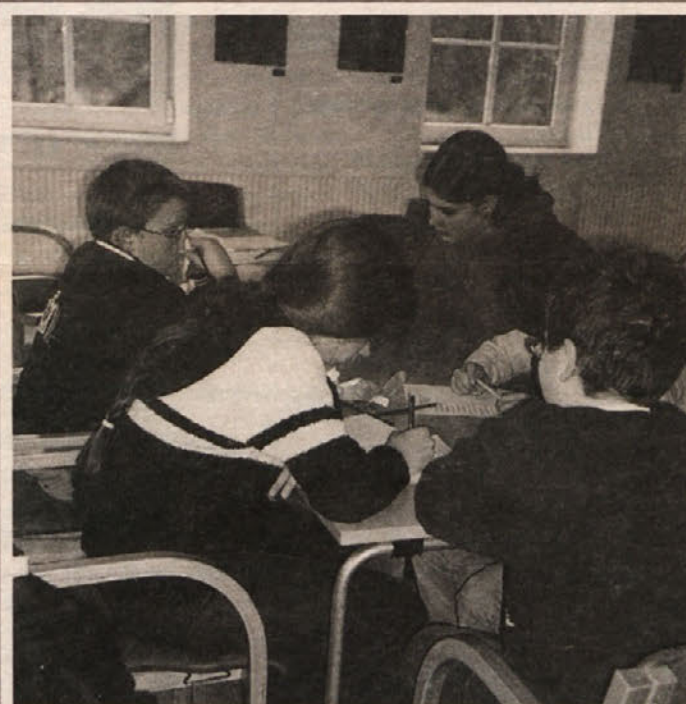
Učence in učenci pri skupinskem delu