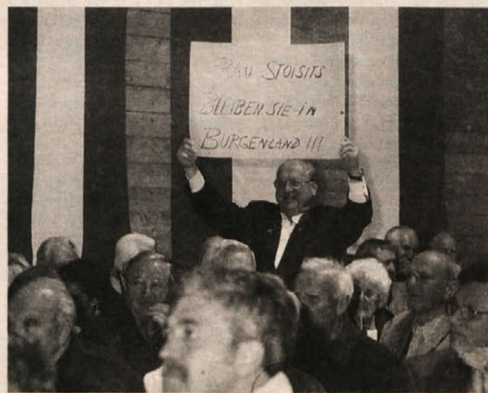
Frau Stoitsits, bleiben sie im Burgenland!!!