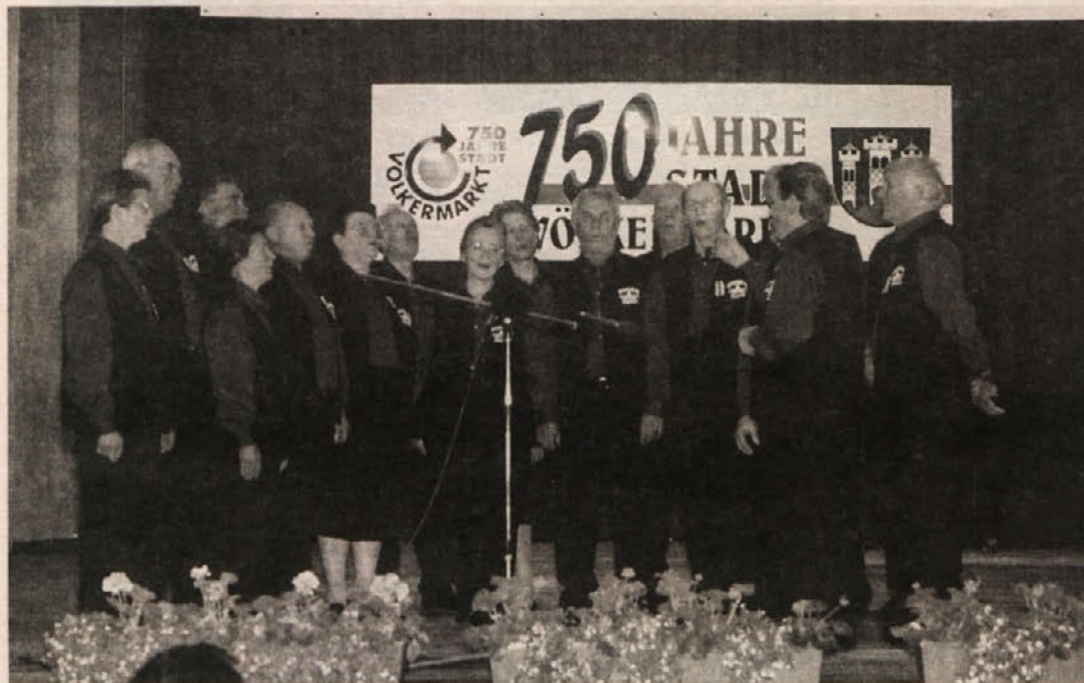
Zbor »Korenine Danice« Slovenskega prosvetnega društva »Danica« iz Šentprimža