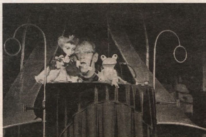
Pikce s pikcami za pikce pri pikcah itd.