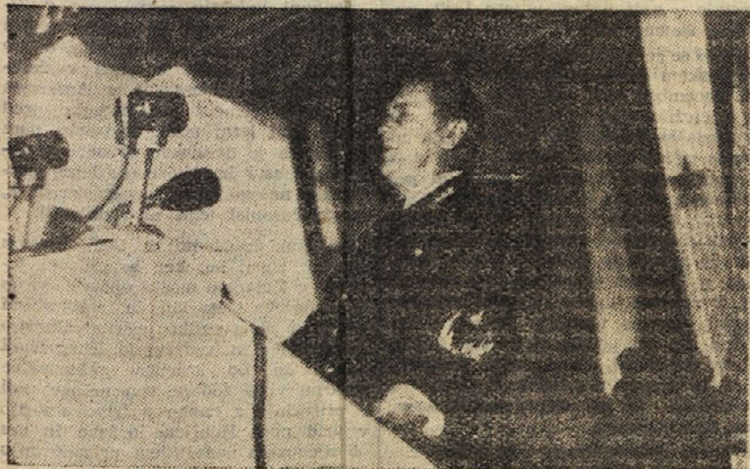
Tovariši in tovarišice, državljani in državljanke!

Vstopamo v novo leto 1951 s številnimi novimi zmagami naših delovnih ljudi. Lahko rečemo, da smo v preteklem letu premagali razne velike težave, ki so se včasih zdele skoraj nepremostljive. Vstopamo v novo leto navzlic vsem neugodam, ki so nas spremljale v preteklem letu, z velikimi delovnimi zmagami naših delovnih ljudi.