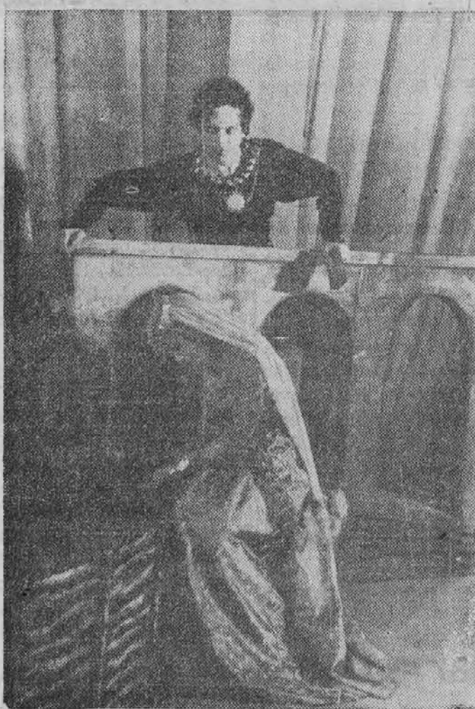
Prizor iz drame "Hamlet"