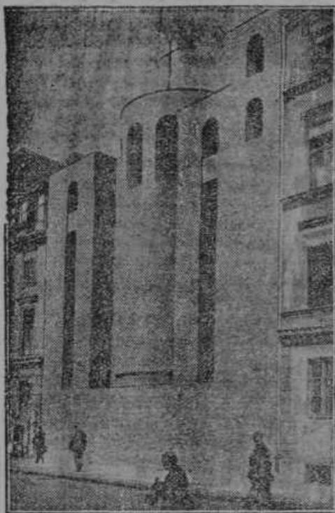
Cerkev brez glavnih vrat na ulico. Novo cerkev sv. Adalberta bodo blagoslovili te dni v Berlinu. Vhod v svetišče je iz sosedne hiše ob desni strani.

Bodite trdni v verskem prepričanju, značajni v krščanskem življenju, miroljubni v medsebojnem občevanju. Sami iztrebite iz svoje sredine razvade, ki Vam jemljejo dobro ime, ter rešite pred svetom čast slovenskega fanta!