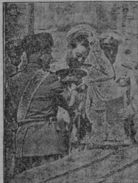
Po še precej srečni vrnitvi z vodnimi letali iz svetovne razstave v Čikagi preda Mussolini vodji poleta generalu Balbi maršalsko čepico.