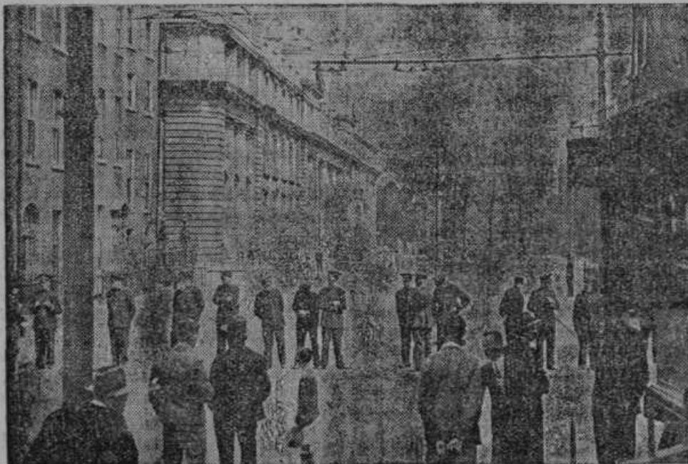
Na Irskem nastopajo proti vladi de Valere fašisti. Vladna poslopja Irske prestolice Dublina ščiti pomnožena policija.