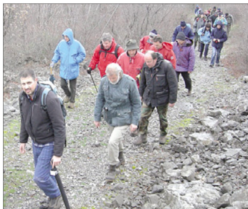
Pohodniki (zgoraj) in medalja za hrabrost, ki ji jo imela pohodnica pri sebi

Prebodli so ga številni italijanski in naši izstrelki, kar nekaj granat je razdejal njegovo bedno deblo, ki sedaj umira. Posebno navezanost čutim za to nesrečno bitje, ki gre po kosih, ker njegova usoda je naša usoda ...« Madžarski vojaki so murvo preimenovali v »doberdobsko drevo«, ker so z Doberdobom poistovetili vsa kraška bojišča in peklen na njih. To ime se ga drži tudi danes v muzeju, od koder so ga pred nekaj dnevi, po skoraj sto letih, za kratek čas vrnili rodni Martinščini. Jutri ob 11. uri bodo na tamkajšnjem sedežu krožka Visintin, ob športnem igrišču, odprli razstavo, na kateri bo glavni eksponat ravno