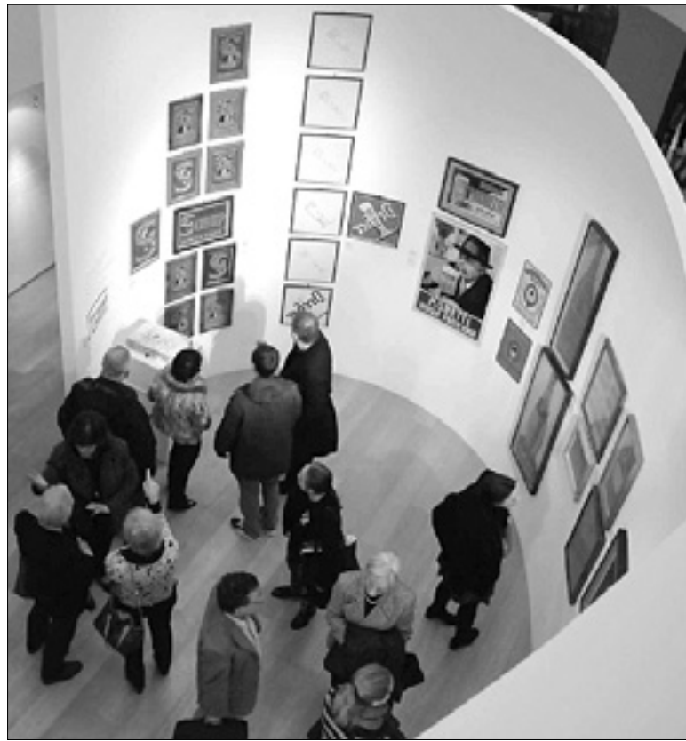
Razstava v prostorih palače v Gosposki ulici