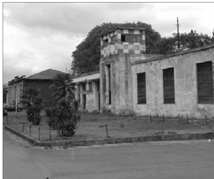
Skupna seja na sovođenjskem županstvu in propadajoči objekti na letališču