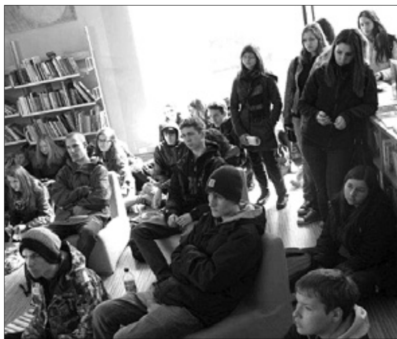
Novogoriški srednješolci na obisku v Feiglovi knjižnici

V Feiglovi knjižnici v Gorici je bilo zadnje mesece živo tudi zaradi številnih jutranjih obiskov dijakov iz Nove Gorice, ki so se seznanili z organiziranostjo Slovencev v Italiji, z društveno razvejanostjo na področjih kulture in športa, s šolstvom in seveda tudi s slovenskimi knjižnicami v Italiji. Nekateri med njimi so kasneje obiskali Feiglovo knjižnico za lastne potrebe, kar kaže na korist tovrstnih srečanj. V knjižnici pa obžalujejo, da se na skupinske obiske ne prijavljajo goriški srednješolci in višješolci, čeprav jim je bil ob začetku šolskega leta ponujen voden obisk s knjižnim darom, ki ga poklanja slovensko ministrstvo v okviru projekta »Rastem s knjigo«; z izjemo doberdopskih srednješolcev drugih šol ni bilo na spregled. Cilj omenjenega projekta je spodbuditi dostopnost kakovostnega in izvirnega slovenskega mladinskega leposlovja, motivirati dijake za branje in jim omogočiti, da spoznajo, kaj knjižnica ponuja, in da postanejo njeni samostojni uporabniki.