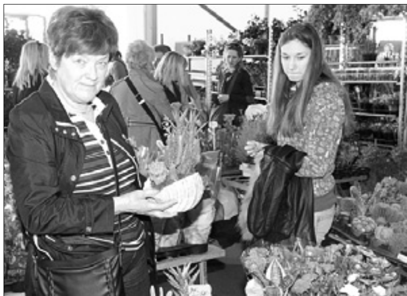
Na sejmu bo obiskovalcem na voljo bogat izbor rož in drugih rastlin BUMBACA

Obiskovalci bodo 5., 6. in 7. aprila imeli priložnost za ogled in nakup rož,