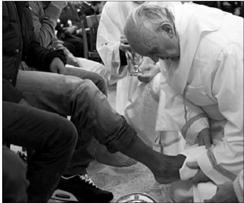
Papež Frančišek umiva nove zaporniku