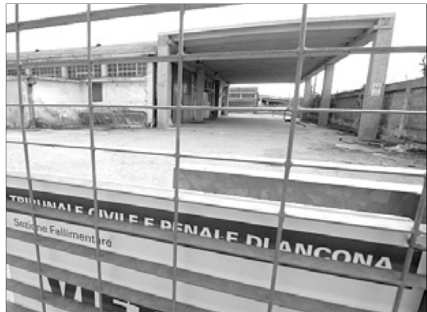
Zapuščeni prostori podjetja, ki je šlo v stečaj

Čeprav so zlati časi minili, pa ostaja Proseška postaja gospodarsko še vedno zanimiva. Sedaj delujeta tu dve špediterski hiši. Ob že omenjeni F.lli Prioglio še podjetje Interland. Obdržalo se je, ker se je znalo prilagoditi trgu. Ob