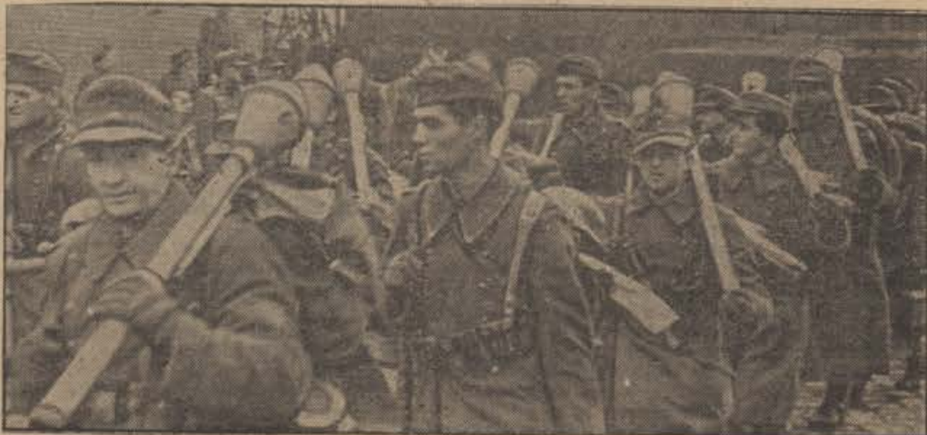
Neue Bataillone für die Front Frisch ausgerüstete Panzergrenadiere marschieren zur Verteidigung Obeschlesiens an die Front

* Poštni paketi vojakov s civilnimi oblekami. Pakete, s katerimi pošiljajo vojak domov svoje civilne obleke, niso podvrženi kontingentu. Pošte sprejemajo take pakete tudi v primerih, če je naslovna pošta zaprta za paketni promet, v kolikor se obavlja še poštna služba. V primerih, da je ustavljen poštni promet v dobičnem kraju, se pošljejo taki paketi nazaj na poveljstva Wehrkreis-ov, od koder so prišli. Pošiljatelji lahko navedejo potem druge naslovnike