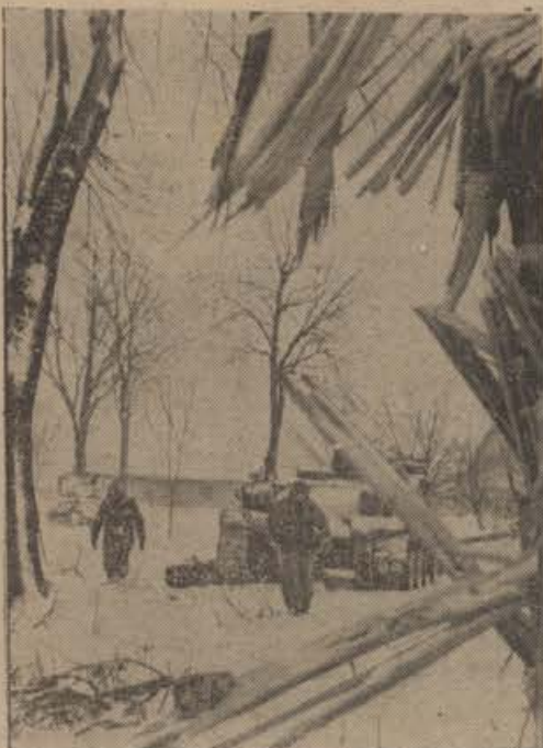
Kampf in Ostpreußen

Nemški borec na vzhodu je moral v zadnjih tednih, v katerih so se boljševiki po prodoru pri Baranovu globoko zarili v staro nemško ozemlje, izdržati naval velikih človeških in materijalnih mas. Tekom številnih protinapadov, v katerih smo zopet zavajevali mimogrede izgubljeno ozemlje, so izsledile naše čete sledove gnusnih zločinov, ki so jih izvrševali boljševiki z neverjetno bestialnostjo. Pogled na pobite žene, otroke in starčke se je nemškemu vojaku globoko