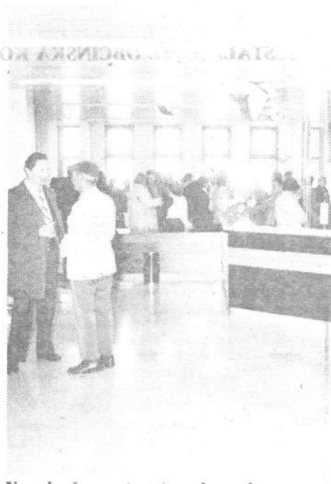
Nova bančna enota v trgovsko poslovnem centru na Rakovniku bo krajanom pribrala marsikatero zamudno pot v mesto. Končno so se jim le začele izpolnjevati želje, da bi vsaj najnujnejše stvari lahko opravili »doma«.