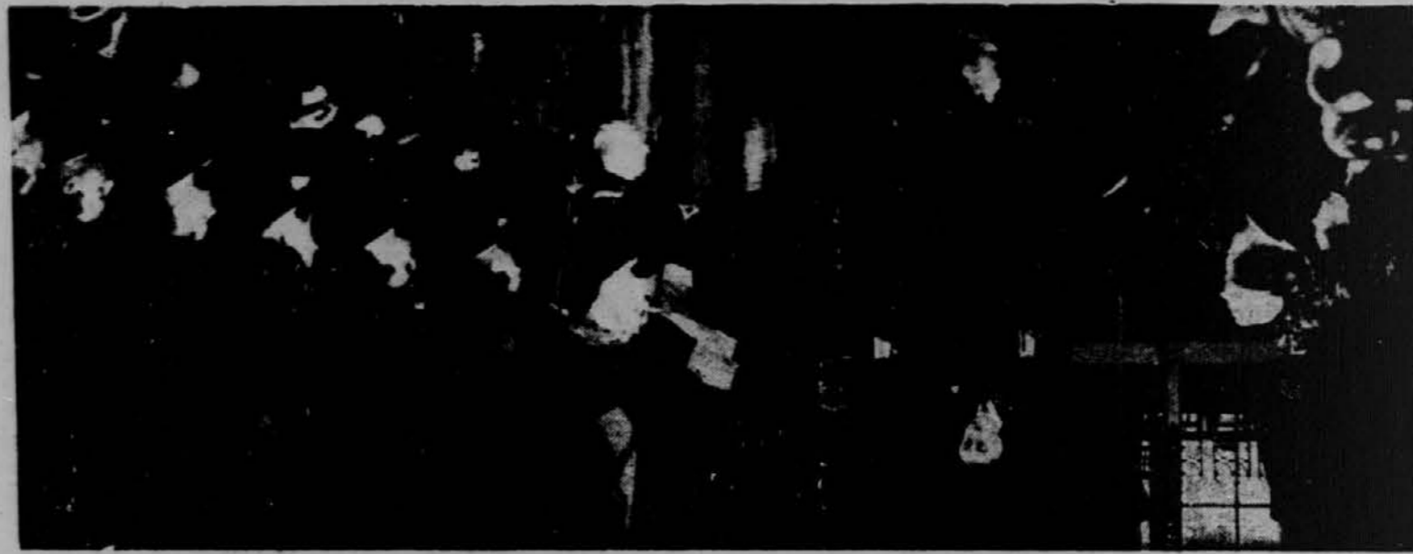
Na sestanku Pan-ameriške unije je predsednik Roosevelt opozoril diktatorske države, da se bodo ameriške republike uprle vsakemu napadu od zunaj.