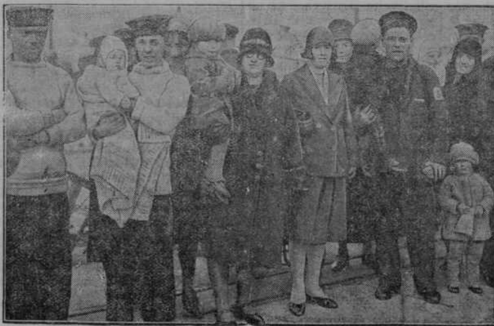
Nekaj mornarjev angleške podmornice »Poseidon«, ki se je potopila na Kitajskem. Na sliki vidimo par mornariških družin kratko pred odhodom podmornice iz Angleške na Kitajsko.