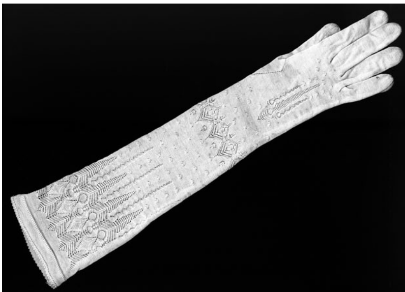
Ženske rokavice iz prve polovice 20. stoletja – pletene bombažne rokavice, ki so dami segale do komolcev. Rokavice so bile obvezen del plesne garderobe. (Muzeji in galerije mesta Ljubljana)

V osmi točki poudari, da se je treba zavedati, da je ples pravzaprav spremljanje glasbe s telesom, gibati se moramo v taktu in s tem navzven izraziti občutke, ki jih skriva glasba. Samo tisti, ki sledi tem pravilom, bo zagotovo plesal z oliko in občudovanjem. Kot pravi, samo surovež lahko najde užitek v norenju pri plesu, pri tem pozabi na vso omikanost telesa, poleg tega pa ogroža še zdravje in zabavo soplesalcev. V zadnji točki doda še nasvet, da je pri plesu vedno nujno nositi rokavice. Opozarja, da moramo biti dvakrat bolj previdni, da se s preznojenimi rokami ne dotikamo soplesalk. Ker je pri daljšem plesanju znojenje nemogoče preprečiti, je ples brez rokavic resna kršitev primernega tona, pri damah, kot doda, pa tudi kršitev zoper sramežljivost v javnosti. 13