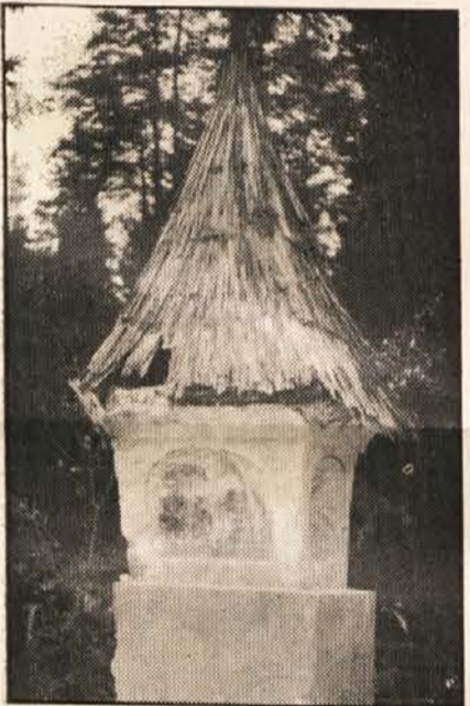
To znamenje prav gotovo ne dela časti turistični občini ob Vrbskem jezeru.

Iz teh nekaj podatkov lahko razvidimo, da je bil pogled nazaj v leto 1983 razveseljiv in spodbuden tudi za prihodnost.