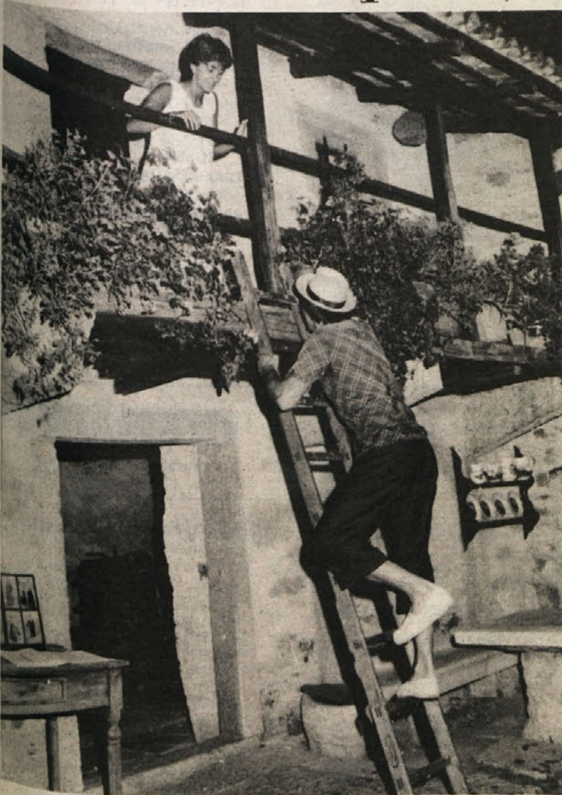
Podoknica kot v starih časih...

Ko skušamo obuditi ali prikazovati stare običaje, jih nekako že podzvestno primerjamo z današnjim načinom življenja. Zato si moramo velikokrat priznati, da so spremembe sicer vidne, toda pogosto bolj formalne kot vsebinske.