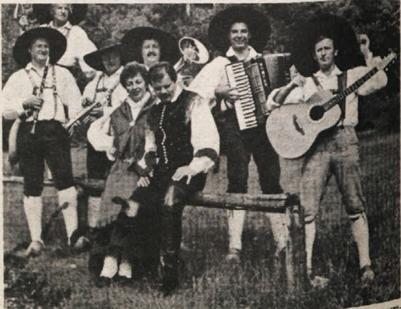
Drevi ob 19. bo v okviru praznika KD Jezero nastopil priznani narodnozabavni ansambel «Veseli planšarji». Ansambel, ki ga sestavlja inštrumentalni kvintet skupaj s pevcema, nastopa že od leta 1955. Na prazniku PD Jezero je že nastopil leta 1961 in tedanje kronike pišejo o «tisočglavi množici» na koncertu.

SOČA 10.00 «Beli bim in črno uho», 2. del, sovjetski film; 17.00, 19.00, 21.00 «Meja na Rio Grand», ameriški film. SVOBODA 17.00 «Beli bim in črno uho», 2. del, sovjetski film; 19.00 in 21.00 «Belo blago za Hongkong», ameriški film. DESKLE 18.00 «Beli bim in črno uho», 1. del, sovjetski film; 20.30 «Razbojnik s plavimi očmi», ital. film.