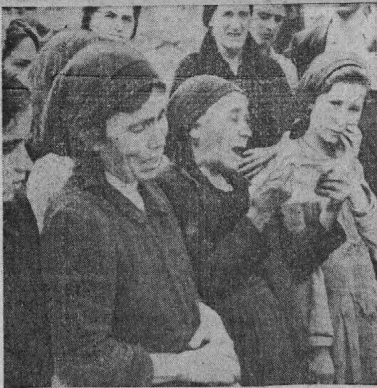
V Rionero, Italija so Nemci ustrelili 16 moških, ker je bil v dotičnem kraju ustreljen nemški kurji tat. Slika nam kaže jokajoče ženske, ki pripovedujejo žalostno zgodbo kanadskemu vojaku.