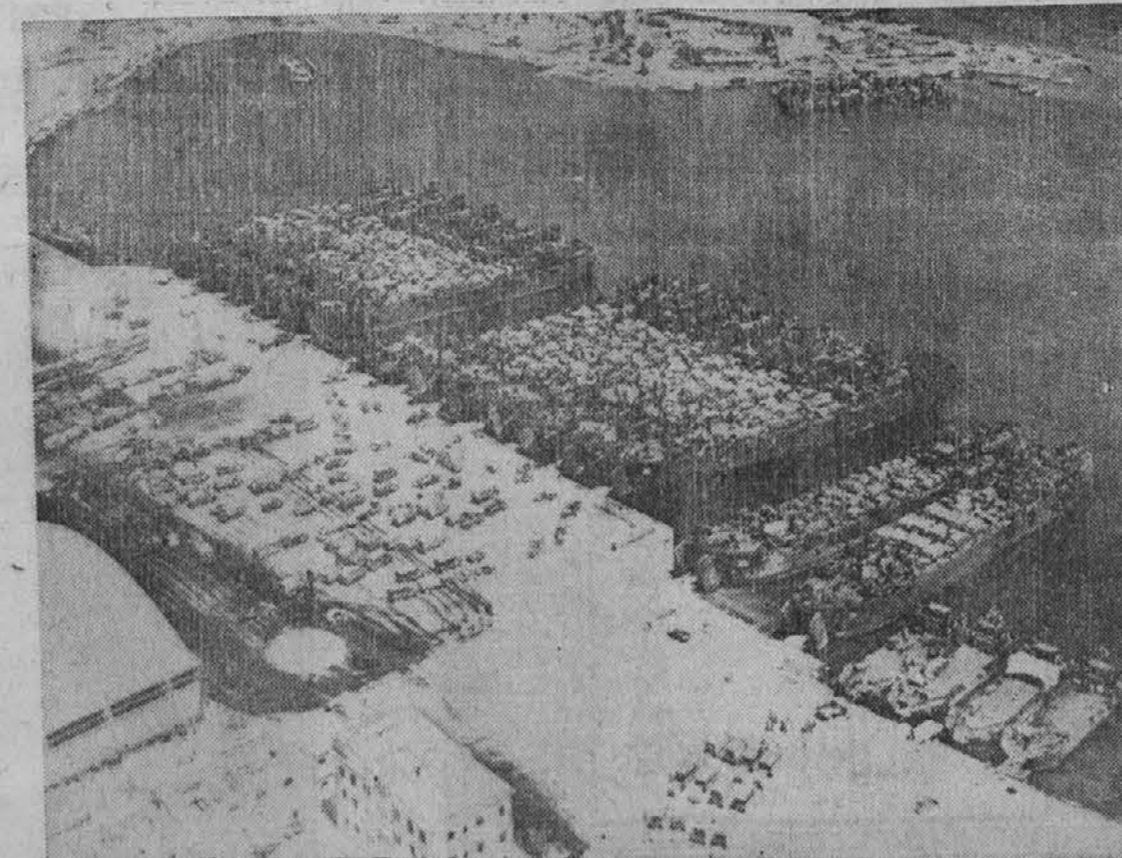
Zanimiva slika nam predstavlja skupino transportnih ladij, ki so pripeljale v neimenovano pristanišče Severne Afrike veliko število tankov in drugih motornih vozil. Te vrste ladje so jako pripravne zato, ker lahko zvozijo skoro prav do obale in so tudi zgrajene tako, da lahko hitro izložijo blago, ki so ga pripeljale.