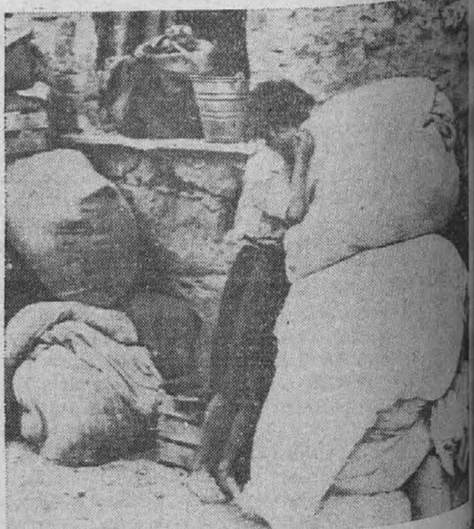
Ne očeta, ne matere, nikogar ni bilo, ki bi bil sprejel to ubogo dekletce, ko se je vrnilo na svoj porušeni dom. Take slike iz vojne se nam nudijo iz vseh nesrečnih krajev, katere je zajela ta vojna vihra.