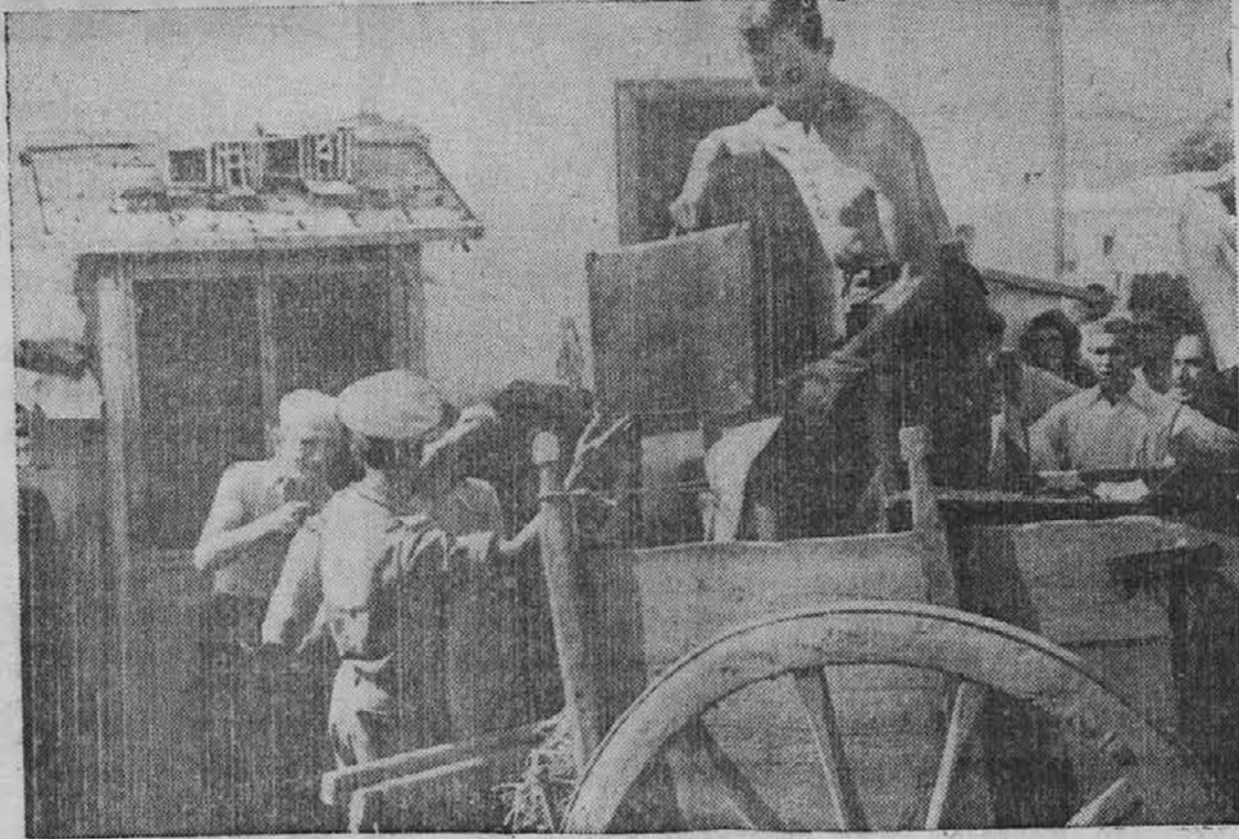
Britski Tommy (vojak) stoječ poleg voza, pomaga protifašističnim Italijanom nakladati na voz njih imovino, ko se vračajo iz koncentracije v St. Di Barraccano, kjer so bili internirani v času nacijske nadvlade v Italiji. Po prihodu zavezniške vojske pa so bili vsi oproščeni in so se lahko vrnili na svoja doma.