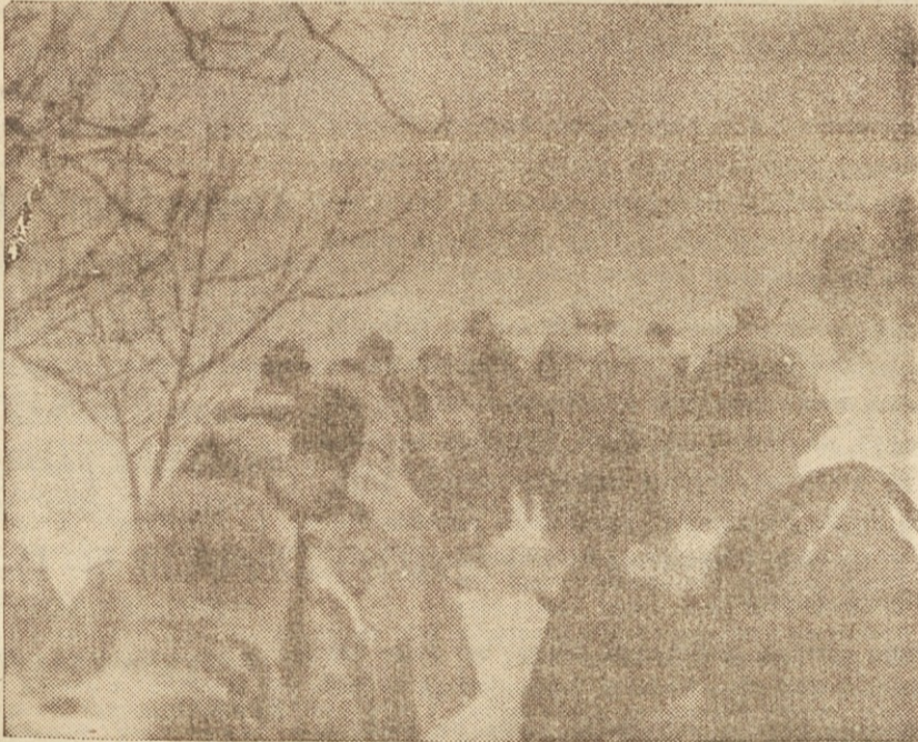
Herojska XIV. divizija v snežnem metežu na Stajerskem pozimi leta 1944

Naše ogromne žrtve niso bile zaman. Tega se zaveda sleheren naš deloven človek. Delavski razred pa, ki je med borbo in v času obnove dokazal, da je graditelj naše lepše bodočnosti, ne bo mogel nikdar dovolj biti hvaležen naši slavni armadi in sovjetskim narodom, ki so rodili Rdečo armado. S pomočjo kmetov in ljudske inteligence ter pod zaščito svoje ljubljene ljudske vojske bo dokazal, da zna delati in graditi prav tako, kakor se je znal boriti in umirati. Tudi v petletki bo slavno zmagal!