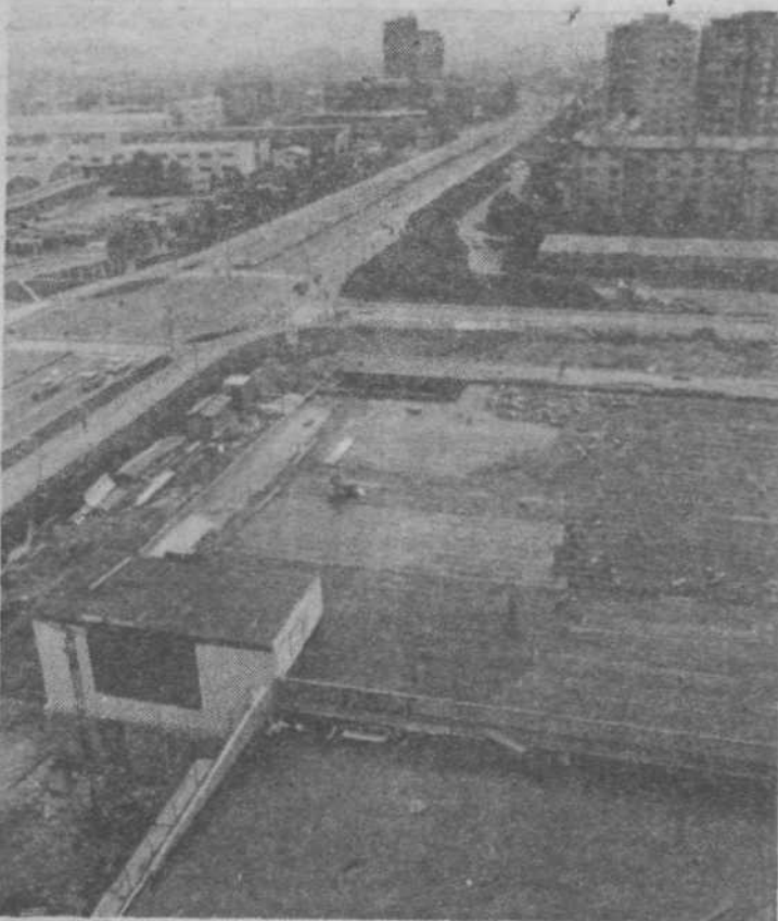
Nova Jarševnica — na sliki spredaj — že dobiva dokončno podobo. Krajanje upajo, da bo čimprej razbremenila za tako veliko naselje res neprimerno Emonino samopostrežno trgovino, ki jo je nagli razvoj naselja dokončno prehitel.