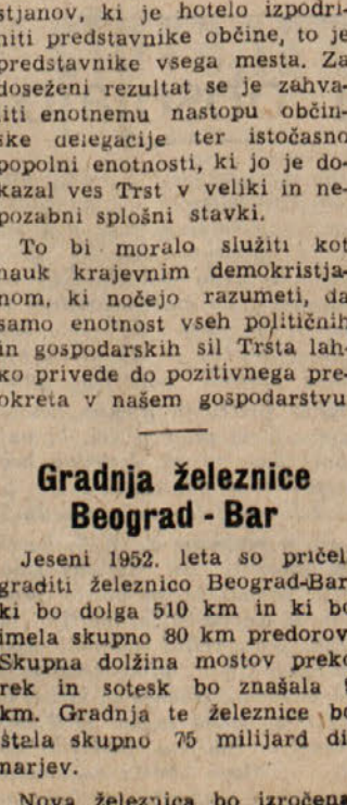
Novo železnica bo izročena