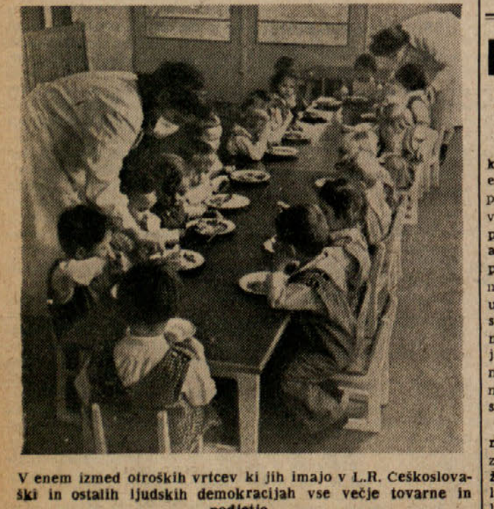
V enem izmed otroških vrtcev ki jih imajo v L.R. Češkoslovaški in ostalih ljudskih demokracijah vse večje tovarne in podjetja

Reke samo 15.000 ton, lani že 108.000 ton. Letos pa do sredine junija že okrog 200.000 ton. Skupno z blagovnim prometom iz Češke in Madžarske, bo letošnje znašal tranzit na 400.000 ton. JUGOSLOVANSKE FREŠKE NA MADŽARSKEM Madžarski inštitut za mednarodne kulturne stike je izrazil željo, da bi razstavo jugoslovanskih fresk prikazali na Madžarskem. Razstava jugoslovanskih fresk se že dve leti prikazuje v večjih mestih Evrope in bo v kratkem odprla v Benetkah.