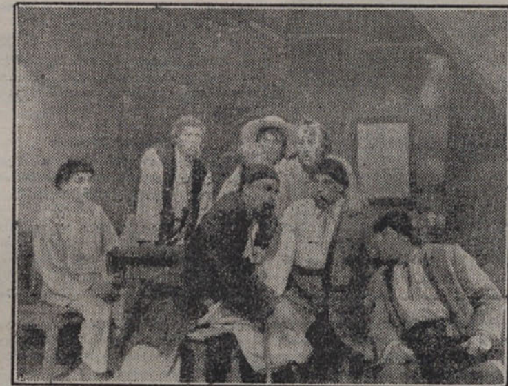
Iz opere Musorgskega «Soročinski sejem», kjer Kum pripoveduje zgodbo o rdečem jopitu.