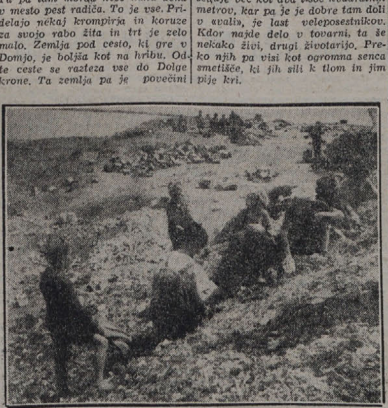
Skupina otrok je »naskočila« nov kup smeti ter brska po njih, da najde kako kost, kos papirja, stekla ali cunj. V ozadju so kupi škotel, ki jih bodo zvečer naložili na vozove in avtomobile prekupevalcev.