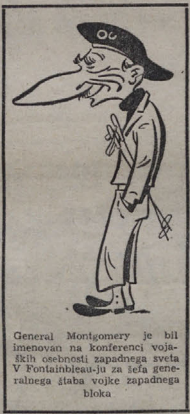
General Montgomery je bil imenovan na konferenci vojaških osebnosti zapadnega sveta v Fontainebleauju za šefa generalnega štaba vojske zapadnega bloka

Profislovja med atlantsko pogodbo in listino OZN so tako številna