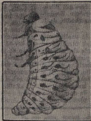
Crv koloradskega hrošča

Hroščji se od časa do časa dvignejo visoko v zrak in tedaj jih veter zanese zelo daleč. Na ta način se je hrošč v Ameriki in Franciji razširil vsako leto za 150 do 300 km. Na stoječih in tekočih vodah plavajoče hroščje lahko daleč zanese in tako tudi voda pomaga pri njegovem širjenju. V oddaljenejše kraje pa se hroščji najlaže zanese s tovori kmetijskih pridelkov. Tudi z drevesci, ki so rastle v rahli zemlji v bližini okuženega krompirjevca polja, lahko prenesemo hroščje, ki so šli zimovat v drevesnico. Kot slepi potniki na ladjah, vlakih in raznih drugih vozilih se hroščji prepeljejo na velike daljave in se tako razširijo. Tako je bil zajedavec večkrat z ladjami prepeljan iz Amerike v Evropo.