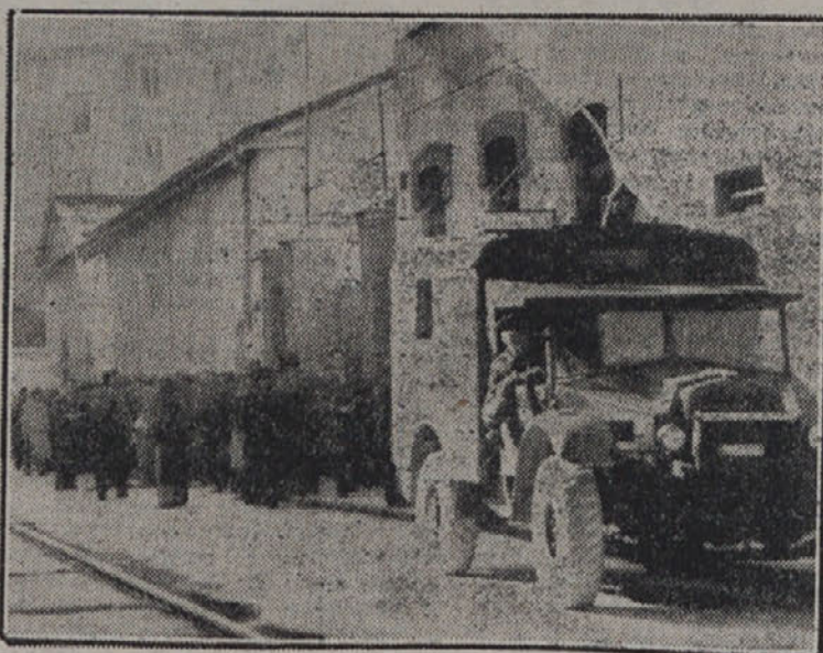
Policijski avto pred poslopjem v ul. Conti, kjer je bil «kongres» kamor je policija branila dostop 350 kmečkim delegatom in cone-B in A

Kongres ni protizakonit le zato, ker niso pustili nanj delegatov cone B, temveč tudi zato, ker se v coni A sami niso vršile povsod redne volitve in ker niso pustili nanj niti pravilno izvoljenih delegatov cone A same. Gospodje v odboru strokovne zveze niso namreč poslali vabil njim delegatom, ki jim niso bili povšeči. Delegate za kongres so zbrali, oziroma boljše rečeno, kar imenovali samo v vaseh, kjer se jim je zdel položaj najbolj ugoden. Pa še tam so se