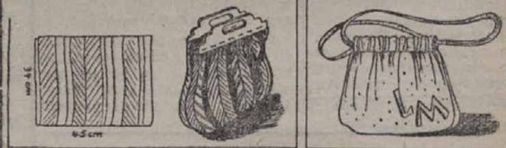
Dve torbici, ki si ju lahko same urojiš iz rišanega blaga