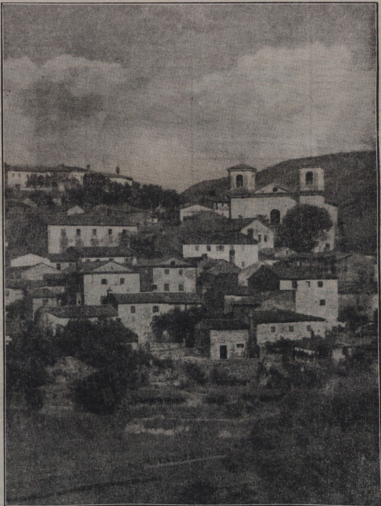
POGLED NA RICMANJE

UREDNIŠTVO: Via Montecchi 6-II - 24, UPRAVA: Via Ruggero Manna štey. 29, TELEFONI: uredništvo 93808, uprava 27847. OGLASI pri upravi od 8.30-12.00 in od 15.00 do 18.00 ure. Rokopisi se ne vračajo. - Poština plačana v gotovini - Spedizione in abbonamento postale secondo gruppo.