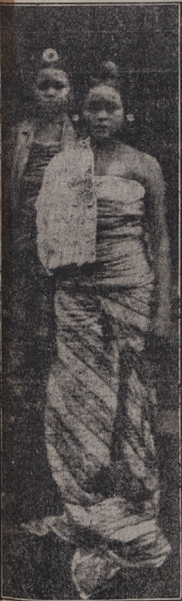
Večno mlade Javanke

mo zrno praška, ki ga maščevalni domačini izdelujejo iz teh listov, lahko naredite svoj testament. Ze petintrideset let je, odkar mi je lepa črna hčerka iz Djokjakarte vrgla v mojo spalnico ščepec prahu kečubuma. Okoli mene se je začelo vse vrteti in jaz sem obstal kot paraliziran.