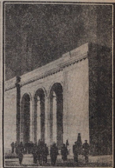
V rudniškem kraju Gorlovki je bilo v carski Rusiji vse zelo revno: ob bližnjih cestah so stali siromašne, borne lesene hiše, a rudarji so živeli v veliki revščini. Tega se še dobro spominjajo starejši ljudje, ki so po revoluciji zgradili novo Gorlovko, katero pa so Nemci ob svojem barbarskem pohodu uničili. Danes stoji zopet nov rudniški kraj Gorlovka, lepši, kot je bil prej. Po delu pa se njegovi prebivalci peljejo v klube in gledališča s svojimi avtomobili.

Na ponedeljskem zasedanju Vrhovnega sovjeta so enoglasno odobrili proračun.