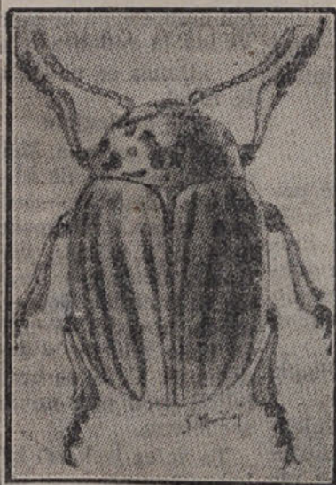
Koloradski hrošč (Naravna velikost 1 cm.)

prinesli nemški vojaki iz Francije v Piemont, nakar se je razširil tudi po Lombardiji. Nedavno je bil tudi zaznamovan v Revigu,