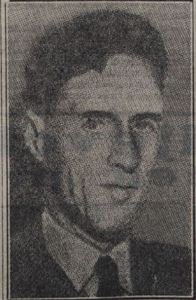
Angleški fizik BLACKETT, avtor knjige «Politične in vojaške posledice atomske bombe».

Britanski krogi niti ne morejo predstaviti Blacketta kot tajnega agenta «komunistične internacionale», čeprav bi to hoteli. Blackett je v javnosti znan kot antifašist, kot eden izmed onih britanskih znanstvenikov, ki jih je Hitler postavil na listo onih, ki bi morali biti aretirani v slučaju nacistične invazije v Anglijo. Blackett je smatran kot progresist, toda vsi vedo da ni ne komunist in ne marksist. Samo izrazoslovje njegove knjige to potrjuje. Angleška in ameriška vlada se tako spričo tega napada