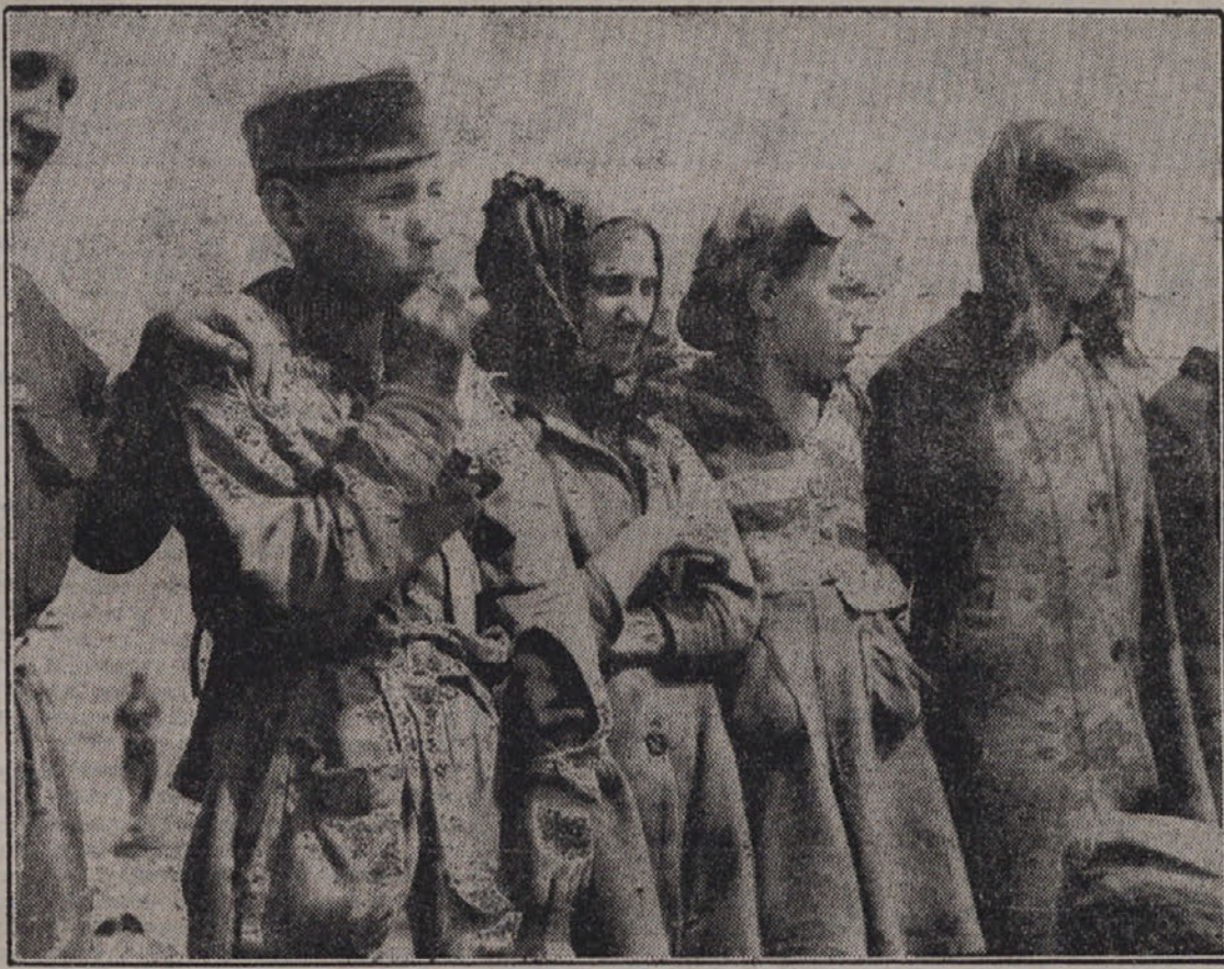
Zelo so mladi toda njihovi obrazi so izpiti in staričkavi; pozna se jim, da trpe bedo in pomanjkanje. Kakšno bo njih življenje? Če so že sedaj zagrenjeni?