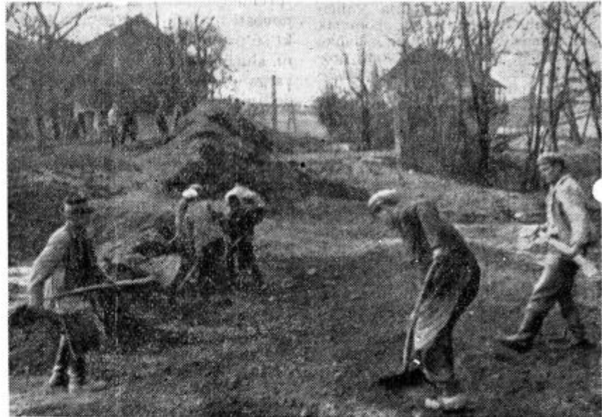
Delavci pri gradnji kanalizacije v Lenartu