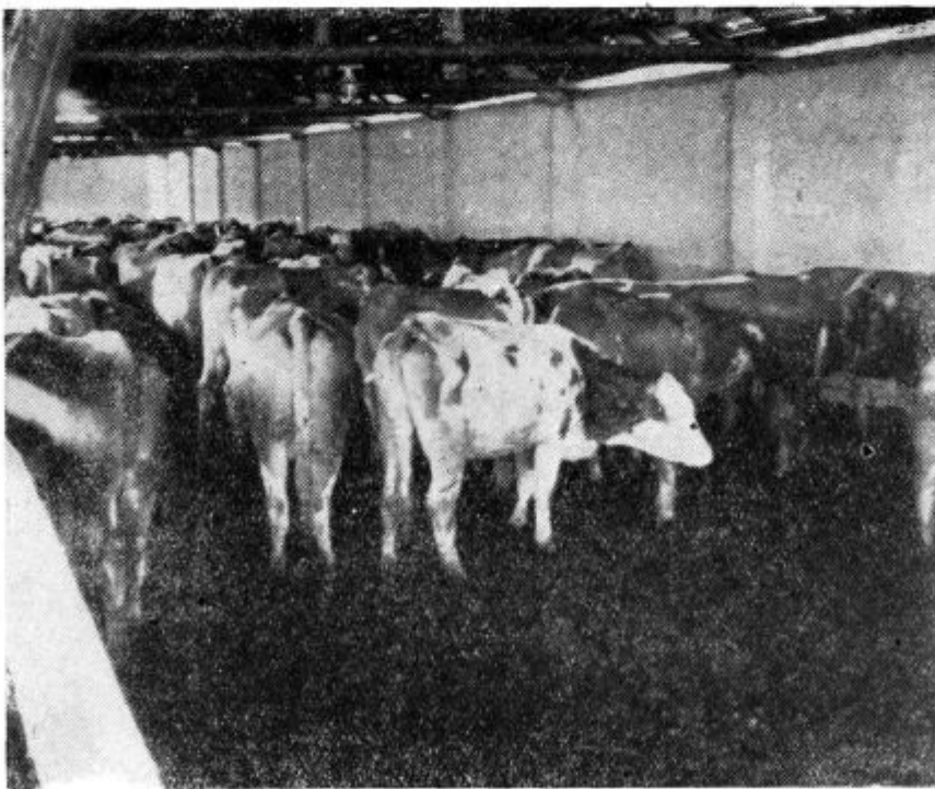
Tudi v odprtem hlevu se v spomladanskem času živina dobro počuti

zagotovili upravniku zadruga v Zg. Ščavnici ne sodi njihova ekonomija, ki obsega 72 ha skupnih površin. Proizvodnja je zlasti usmerjena v