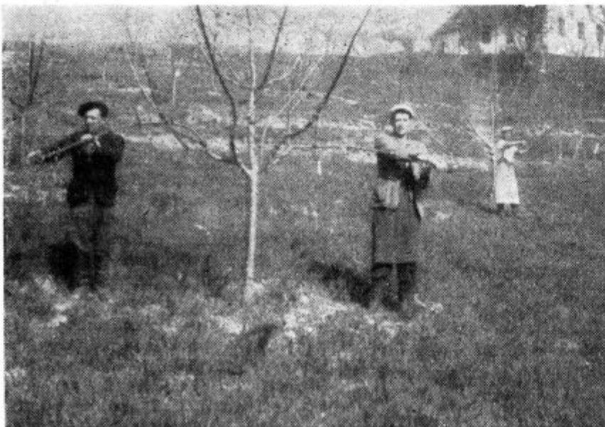
Sadjarji v Cerkevnikju obrezujejo sadno drevje

Tukaj obstaja težnja, da bi lovci pričeli z gradnjo Lovskega doma. Glede tega so že predvideli lokacijo, ki pa ne ustreza, kakor menijo nekateri funkcionarji SZDL. V zvezi s tem bodo preko sekcij za komunalno dejavnost pri KO SZDL proučili, kje naj bi uredili turistično središče. Verjetno bi kazalo razmisliti o ureditvi sedanjega Zadrugnega doma v turistične in lovske namene. Na tem posloju bi bilo potrebno tudi dozdati razgledni stolp. Ker je ta kraj na najbolj privlačni razgledni točki v Slovenskih goricah, bi bilo zanimanje zanj veliko, v kolikor bi se uredile osnovne turistične naprave.