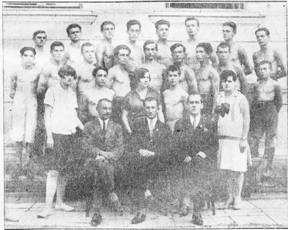
I. prednjački tečaj tuzlanske Sokolske župe.

Tečaj je apsolviralo sa vrlo dobrim uspehom 3, dobrim 12, dovoljnim 8.