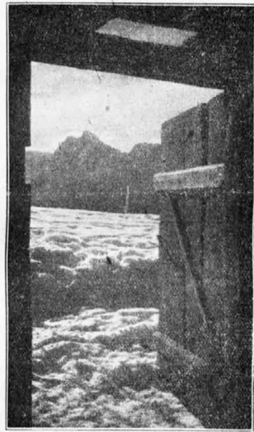
Pogled iz pastirske kuće na Petelinku, na snežno polje i na »Ponce«.

Ovo se društvo putem Sok. Glasnika zahvaljuje na tako velikom poklonu, koji će znati vazda ceniti i nastojati, da se knjige što više čitaju, kako bi od njih narod imao što veću korist.