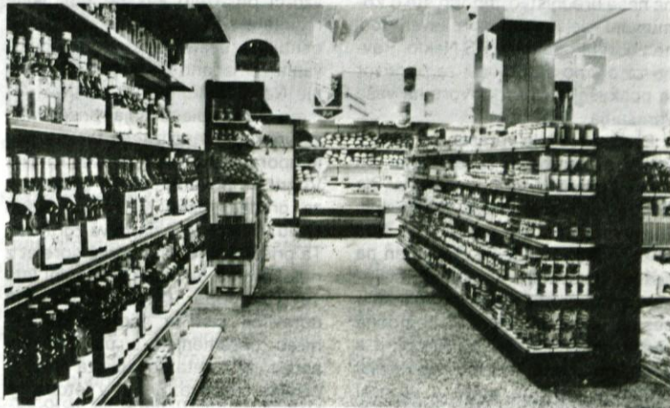
Še nekaj: v trgovini poleg vseh prehrabnih in drugih artiklov za gospodinjstvo lahko kupujete tudi časopise in revije.

Prava miniatura je bila pred adaptacijo trgovina v KS Tabor. Po investiciji, ki je Mercatorjev TOZD Dolomiti veljala skoraj 40 milijonov dinarjev, je podoba povsem drugačna. Povečan prostor in bogato založene police bodo morda pobrale kakšen tisočak več iz denarnic, zato pa bo večje zadovoljstvo kupcev, saj lahko dobijo v svojem kraju veliko več kot prej. Zadovoljne so tudi prodajalke, čeprav so se našemu fotografu zmaknile iz objektiv.