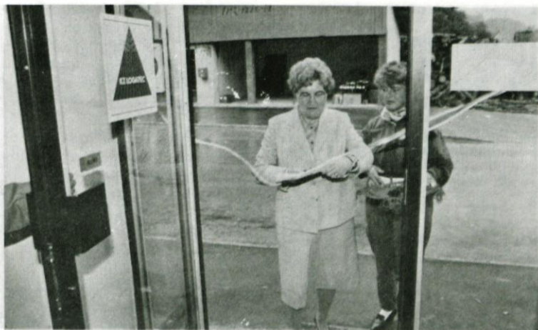
In odprla so se vrata

Investicijska sredstva (skupaj s sredstvi investicijskega vzdrževanja) nam je pomagal oblikovati tudi SOZD Mercator v znesku 12.900.000,- din, in sicer z naslova združenih investicijskih sredstev; hvala lepa za razumevanje.