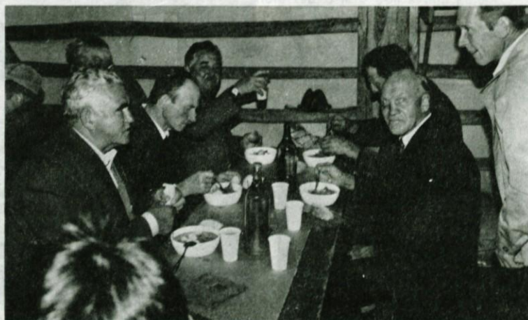
Zdravica prazničnemu dnevu v planinskem domu v Novem svetu