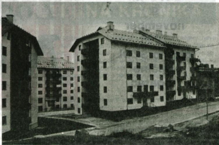
Krajevna skupnost Hotedršica Voda za praznik