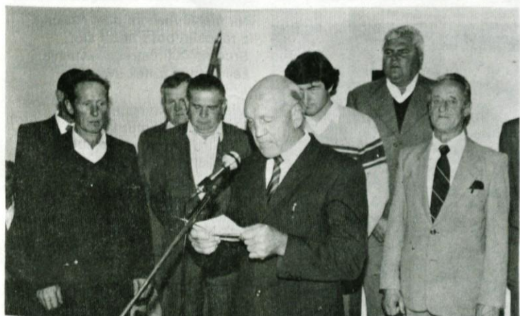
Pisana množica je prisostvovala odprtju nove trgovine