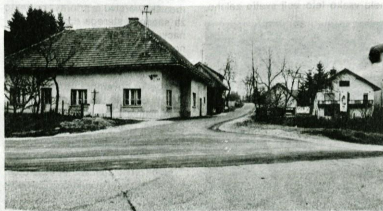
Asfaltirani del ceste proti Kališam bo olajšal tegobe s prahom preivalcem ob tej cesti, ki je precej obremenjena s tovornim prometom.