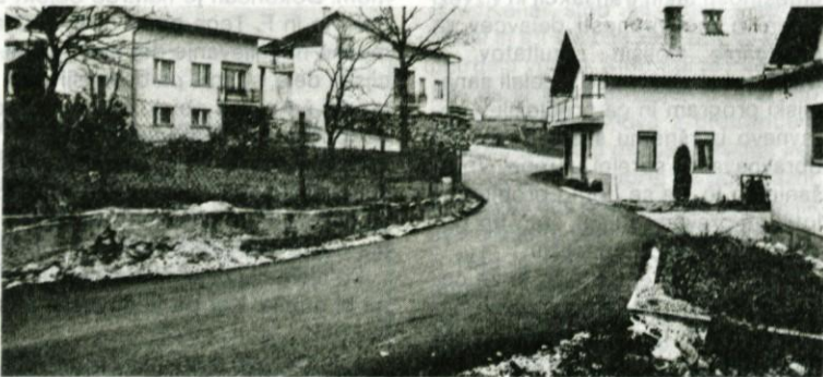
Del asfaltirane ceste na Jamnici v Logatcu.

Pripomb je veliko, razlikujejo se tudi glede na vaško skupnost. Veliko pa je takih predlogov, ki bi jih z resnim pristopom lahko hitro rešili. Iz majhnega raste veliko. Reševanje takih težav bo vzelo tudi manj časa, zato, kot pravi tajnik krajevnih skupnosti, nameravamo najprej rešiti te majhne, a za krajane velike stvari.