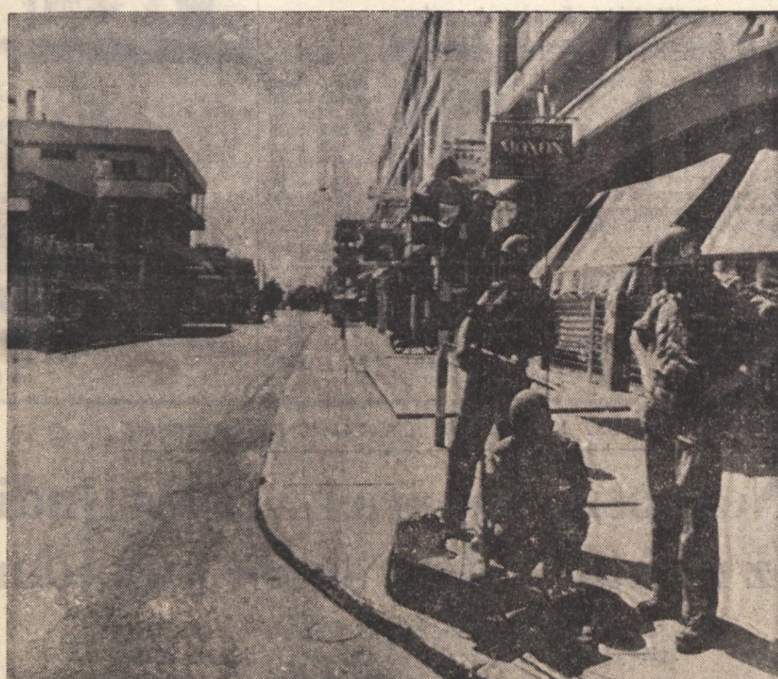
Svedski vojniki OZN v praznem središču Famaguste. Velik del prebivalstva se je umaknil iz mesta, ki so ga zasedle turške vojaške sile

Minister za delo Bertoldi je v intervjuju turinskemu dnevniku «Stampa Sera» ponovil svoje ugotovitve, da bo jeseni v Italiji že milijon brezposelnih. Govoril je o zaskrbljenosti, ki vlada tudi v Turinu zaradi zmanjšanja prodaje avtomobilov in zaradi posledic, ki jih lahko to ima na mnoge druge industrijske dejavnosti, ki so tesno povezane z avtomobilsko industrijo. V tej zvezi je minister poudaril, da vzbuja veliko skrb tudi dejstvo, da mladina ne more najti prve zaposlitve zaradi pomanjkanja dela. Odpustitve z dela pa pričakujejo predvsem v gradbeni industriji, obrtništvu in terciarni dejavnosti. V perspektivi zaostrite gospodarskega položaja si vlada prizadeva, da bi dobila pri gospodarski skupnosti posojilo, ki bi znašalo