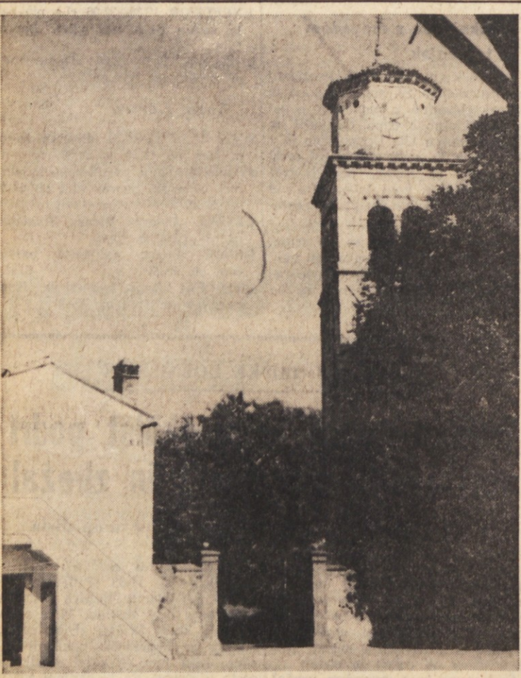
Mavhinje: na sliki je moč le slutiti lepi, z drevesi obdani, prostrani vaški trg, s kakršnim se ne morejo ponašati mnoge vasi. V ozadju župna cerkev