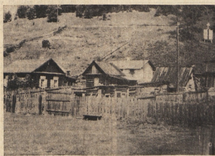
Domačija ob Bajkalu

Skrivnostni Bajkal ali sveto morje, kot so ga imenovali nekdanji sibirski izgnanci in ga še danes tako imenujejo mnogi