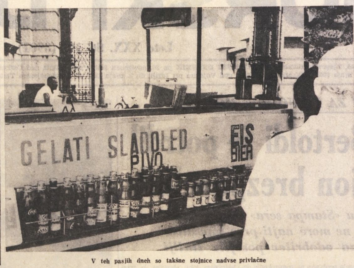
V teh pasjih dneh so takšne stojnice nadvse privlačne

Prevažajo nafto ali gorivo. Poleg velikega naftega madeža, ki ga je povzročila liberijska ladja «Olympic Falcon», se je izlilo predvčerajšnjim v morje tudi nekaj plinskega olja. To je opazil finančni agent, ki je bil v službi na pomolu rafinerije Aquila, ki je vest takoj sporočil svojim nadrejenim. Po prvih raziskavah so ti odkrili, da se je iz tankerja male prevozne ladje neke pristaniške tvrde izlilo za približno 1 kubni meter plinskega olja in to zaradi prenapoljenosti tankerja. Madež so takoj odstranili s posebnimi čistilnimi čolni.