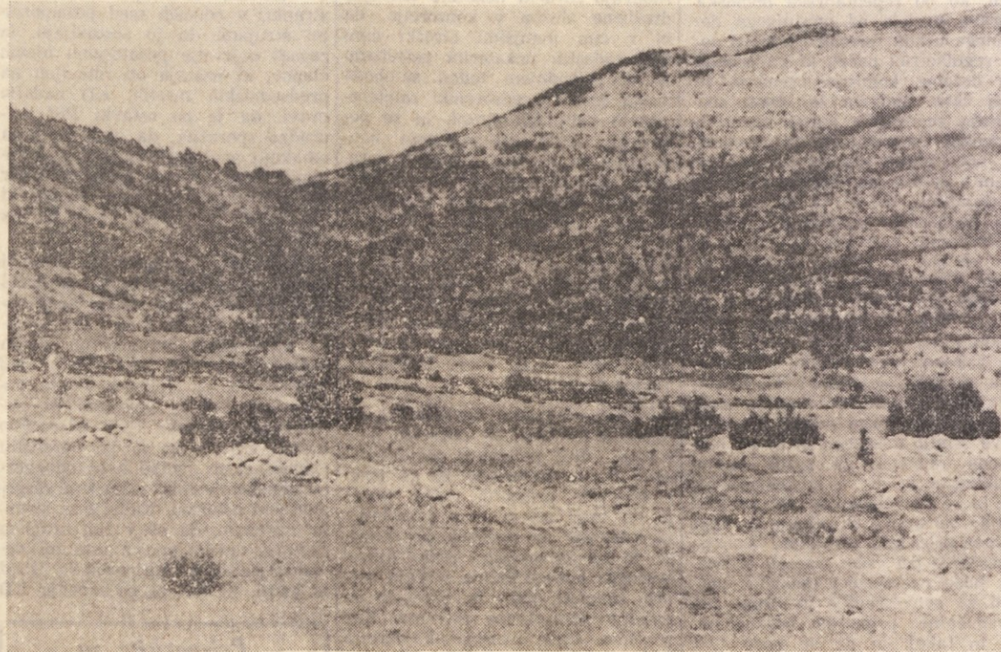
Pogled na Mala vrata iz smeri Jelovice